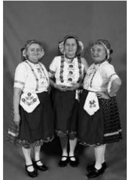
3. kép. Hagyományos helyi szlovák népviseletbe „visszaöltöztetett” asszonyok egy műtermi csoportképen