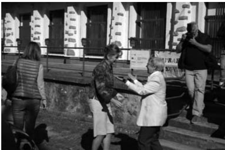
1. kép. Az Egyesület vezetője fogadja Herczegh Anitát Nógrádon, a Tápláló Szeretet 2018. évi ünnepségén

ra kiemelt fontosságú a presztízs növelése. Minden elnyert pályázat, díj egyrészt visszajelzés arra vonatkozóan, hogy a szervezet hasznos és eredményes munkát végez, másrészt a presztízs nem más, mint a szimbolikus tőke növelésének lehetősége, amely megalapozhatja a gazdasági és a társadalmi tőke jövőbeli gyarapítását. 2019 végén „Az év Nógrád megyei önkéntese 2019” díjat kapott a Nógrádi Napraforgó Egyesület, mely hírt büszkén osztotta meg honlapján az Egyesület. 14 Fontos látni, hogy egy lokális szervezet számára cél, hogy kilépjen ebből a keretből, és megyei, netán országos hírnévre tegyen szert. Ennek a törekvésnek jó példája a „Tápláló Szeretet” elnevezésű program. 15 Ennek keretében az Egyesület minden év őszén tartós élelmiszerral ajándékozott meg nagycsaládos rászorulókat. A program 11 éve során elsősorban házilag eltett lekvárt, befőttet és savanyúságot adtak át, évente mintegy 1000 üveggel. Időközben sikerült megnyerniük Herczegh Anita asszonyt, Áder János köztársasági elnök feleségét, hogy legyen a program fővédnöke, aki nem csupán elvállalta, hanem minden évben jelenlétével emelte a program presztízsét.