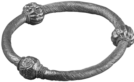
1. kép: A szilágysomlyói eskükarika (MNM Népvándorlaskori Gyűjtemény)

■ A szilágysomlyói kincs legalább két tárgya, az eskükarika és az uralkodói jelvényként szolgáló ónixfibula egyértelműen közjogi jelentőségű, továbbá ebbe a körbe sorolhatók a medallionok és a korongok is. A gömbsoros, illetve lemezes karikák az eskükarika összefüggésében értelmezhetők, és nem különleges, párhuzam nélküli viseleti elemként vagy játékszetonként. Együttes előkerülésük a többi velük együtt elrejtett tárgytól függetlenül azonos kontextusba utalja őket. Az eskükarika, az ónixfibula, a medallionok és a korongok funkcionális és időrendi alapon tehát vélhetőleg egy helyről származó csoportját alkotják a kincsnek. Rajtuk kívül, szertartási jellegét tekintve ehhez a csoporthoz tartozhat a rituális öltözék elemének tekinthető eszközmásolatokkal díszített füstöpáz függővel ellátott hosszú aranylánc.