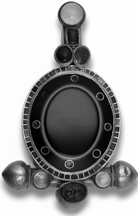
2. kép: A szilágysomlyói ónixfibula (MNM Népvándorlaskori Gyűjtemény)

A leletegyüttes közjogi szempontból legfontosabb tárgya az eskükarika. Felülete kopott, többszörösen sérült és sokszorosán javított, részei cseréltek, azaz hosszú időn keresztül állt használatban. Fettich Nándor közléséhez 37 képest nem egy darab-