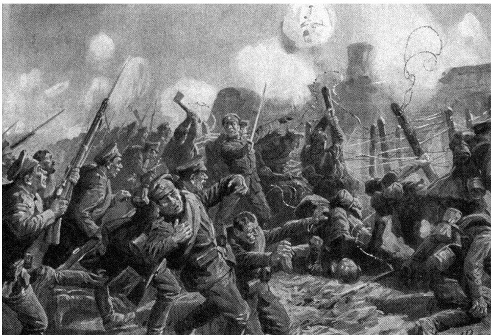
Orosz katonák rohama a védők állásai ellen

November 8-án a Nyikolaj Szelivanov gyalogsági tábornok irányította 11. orosz hadsereg, amely szinte kizárólag tartalékhadosztályokból (északon és északnyugaton a 82. tartalékhadosztály, nyugaton a 9. lovashadosztály, délen a 81., keleten a 60. és 69. tartalékhadosztály) állt, gyűrűje bezárult a vár körül, megkezdődött Przemysl második ostroma. Annak kezdetén 131 000 katona (ebből 7000 sebesült, 1000 kolerás beteg), 30 000 civil (közülük 18 000 főt a katonai hatóságok láttak el), 2000 orosz hadifogoly és 21 500 ló rekedt a várban. A védősereg ugyanazokból az egységekből állt, mint az első ostrom idején, azonban Franz Conrad von Hötzendorf gyalogsági tábornok, osztrák–magyar vezérkari főnök a védőket még a Friedrich Kloiber vezérőrnagy parancsnoksága alatt álló császári–királyi 85. Landwehr gyalogdandárral, valamint a császári és királyi 11. repülőszázaddal erősítette meg. A Przemyslben harcoló osztrák–magyar csa-