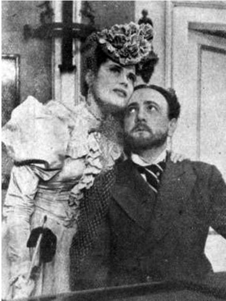
A Tolnai Világlapjában egy előadás fotóján tűnik fel

A Ludas Matyi elnevezésű vicclapban főképp gúnyos, szatirikus hangvételű írásokban jelenik meg Karády, a vicc tárgyaként, pellengérré állítva a népszerűségét. Egy írásban „újságíróképzést” indítanak a lapban, azt ígérve, hogy néhány lépésben megtanítják, milyen a jó riporter. Az álszalagcím-ötlet gunyorosan citálja a Karády-lázatot: „Tömeggyilkos a Nagykörúton. Bombával akarta megsemmisíteni Karády egész tömegét!” (1945. 09. 09./17. szám, 3.).