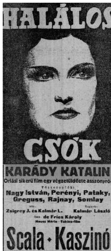
Nemzeti sport , 1942. 10. 19./204. szám, 3.