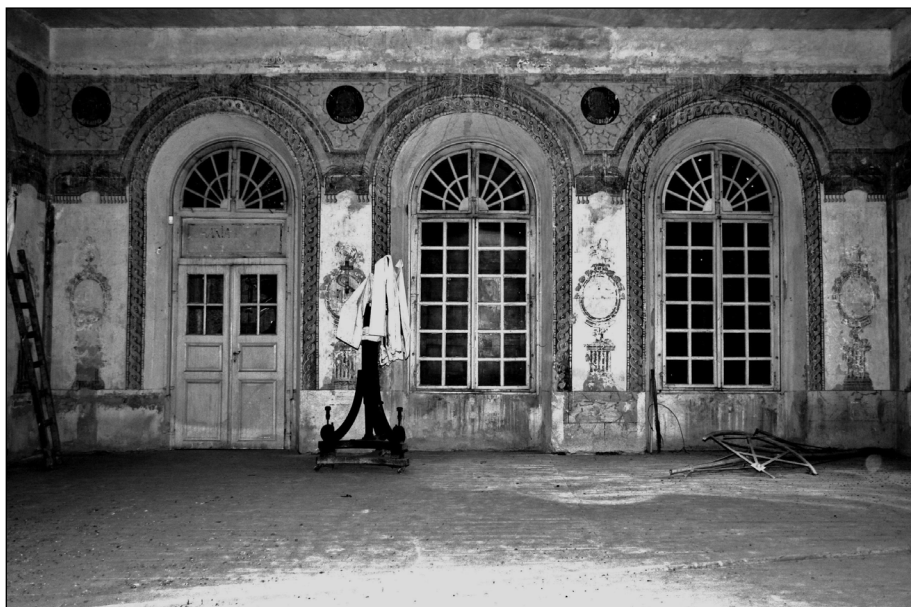
A Batthyaneum csillagdájának nyugati fala. 2008.

A Római Katolikus Teológiai Intézet könyvtáraként működő Batthyaneumba kerültek az egyházmegyei gyűjteménybe sorolt műkincsek (pl. a szászfenesi oltárka), továbbá többek között a székesegyháznak a Pósta Béla vezette ásatásaiból előkerült, máig feldolgozatlan régészeti anyag is, de az államosítás során ott ragadtak a gyűjteményektől teljesen független értékek, köztük Márton Áron püspök iratai,