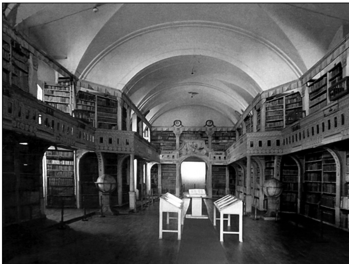
A Batthyaneum könyvtárterme.

könyvtárát hagyományozta a püspökségre. Ezekhez járult az a levéltári állag, melyet a tulajdonos püspökséget közvetlenül érintő anyagnak minősítettek, s a Gyulafehérvári Káptalan, illetve a Kolozsmonostori konvent Levéltárának Budapestre,