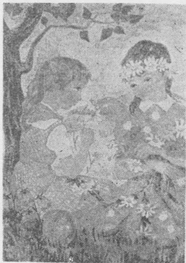
F. Nagy Éva: Napsugár-címlap