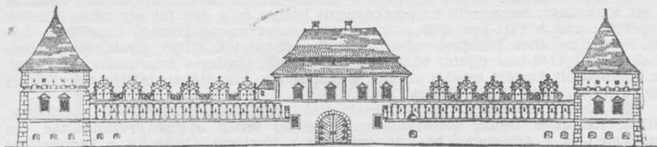
A kastély déli homlokzata

tényező igazolja. Egyrészt ez az építmény a maig is fennmaradt, 1532-ben épült kapuboltnál korábbi, tehát XV. századi lehet. Hogy azonban a század második feléről van szó, azt a falhoz toldott helyiségekből előkerült, ebből az időszakból származó régészeti leletek igazolják. Figyelembe vettük azt az építészettörténeti tényt is, hogy a XV. század végén a tornyokat már többnyire a várfalon kívül építik, tehát a belső tornyos kastély korábbi keletű.