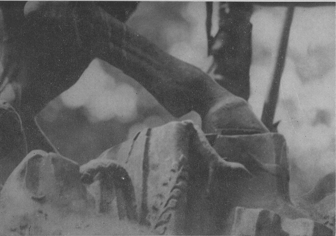
A KOLOZSVARI SZENT GYÖRGY-SZOBOR (RÉSZLETEK)