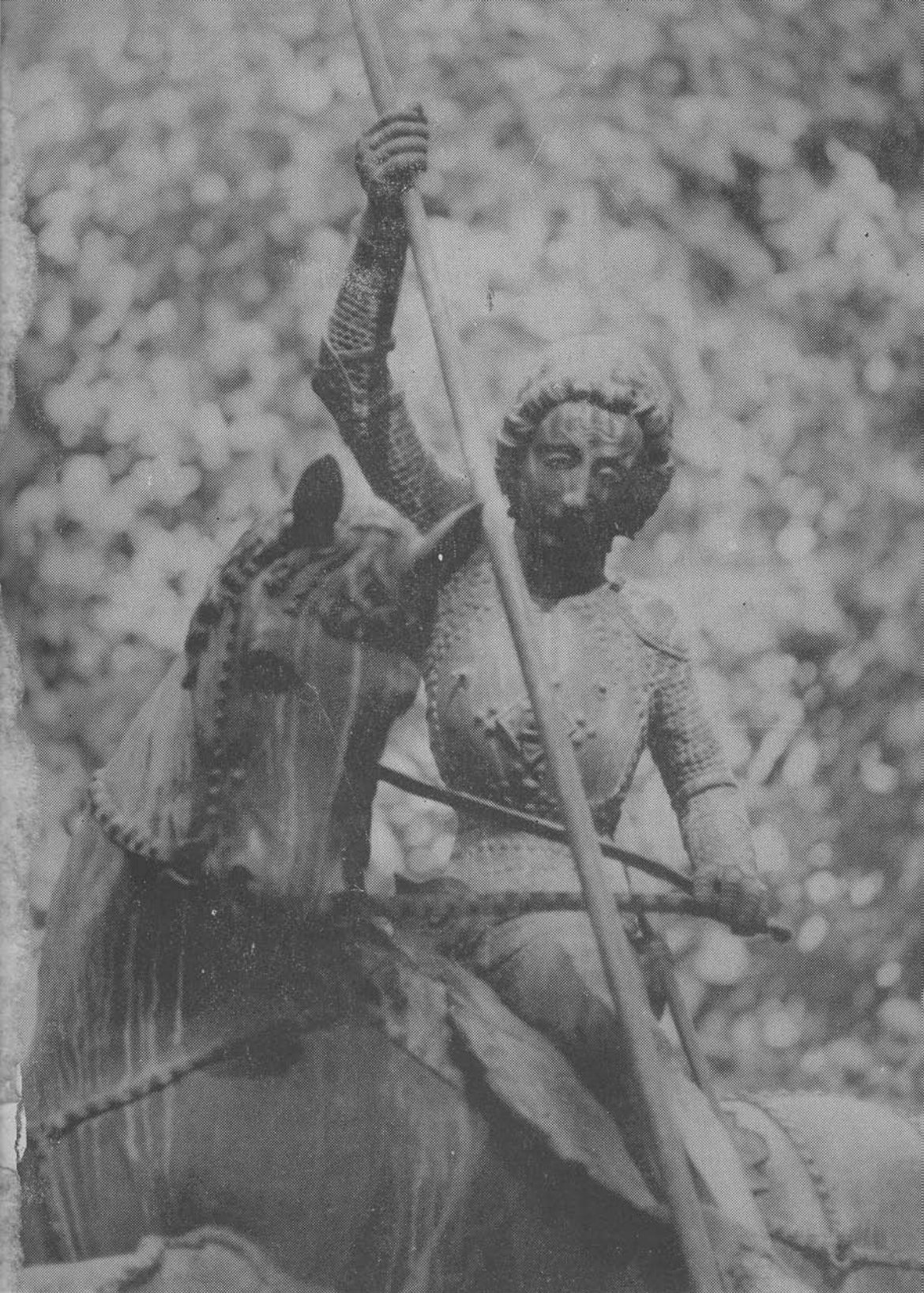
A KOLOZSVÁRI SZENT GYÖRGY-SZOBOR (RÉSZLET)