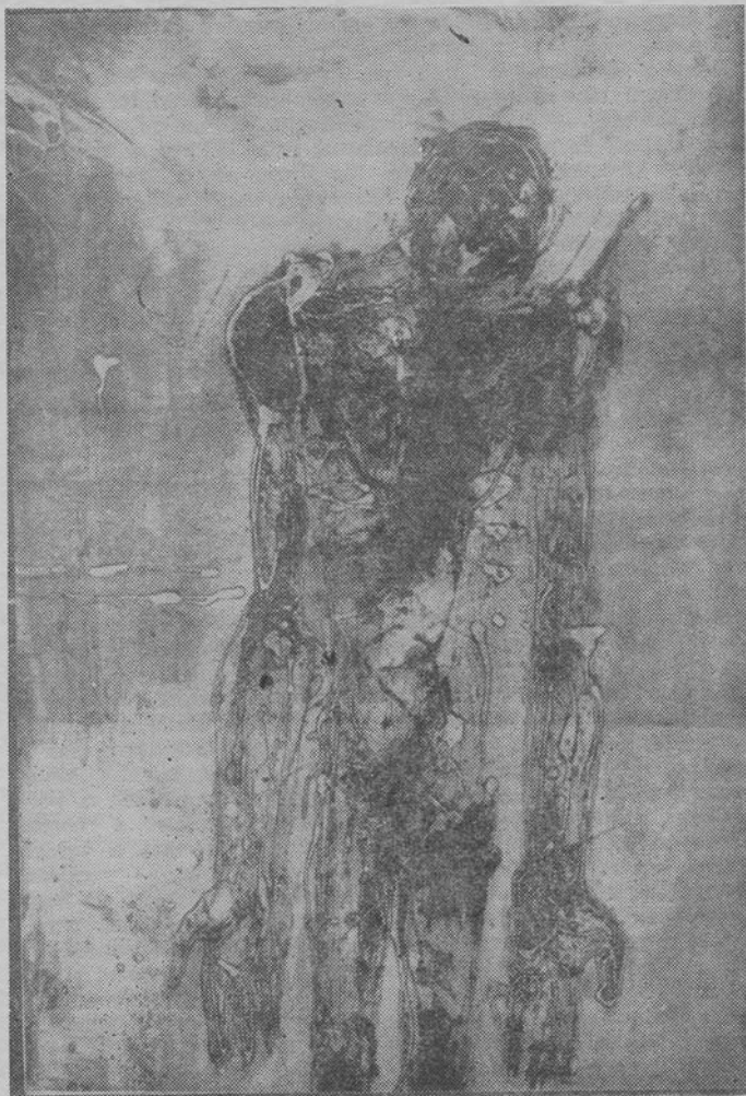
Márkos András: 1514 (I.)