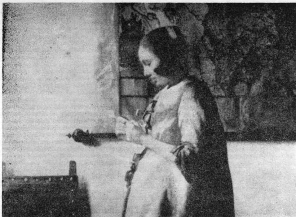
Vermeer: Nő kékbén (részlet)

formálásukra a művész zöld árnyékolást használ, s így egészen sajátos, különös hangzást hoz létre. Ritkább, de különös erejű a fekete-fehér-vörös szinhangsor, ilyen a Hölgy spinéttel és gavallérral vagy a Múterem . Vermeer gyakran dús pasztába ágyazza a színeket, mint a Tejesasszony című képén; az előszeretettel ábrázolt keleti szőnyegetek helyenként úgy festi, hogy szinte a tapintásukat is érezzük.