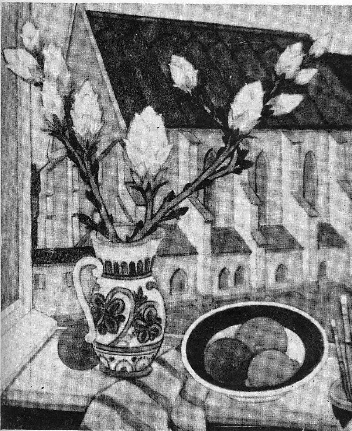
FULÖP ANTAL ANDOR: NYITOTT ABLAK (1974)