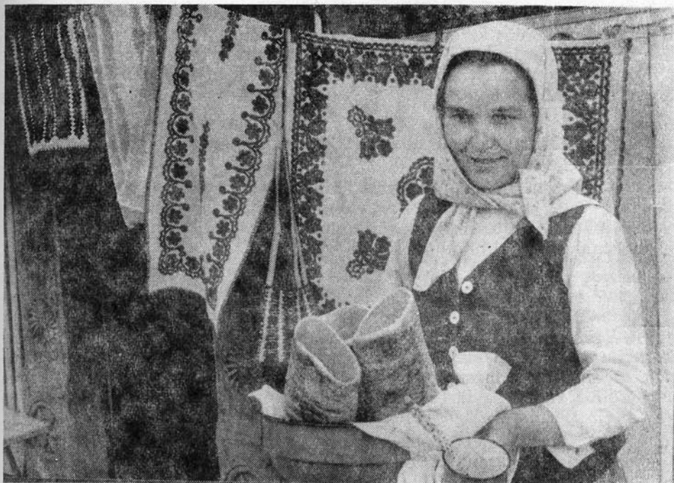
Nagykapusi kürtőskalács

tett helységek közül Egeres és Gyalu ipara a Szamos gyűjtőiből, Hunyad pedig a Sebes-Körös mellékfolyóira épülő gyűjtőkből jut vízhez.