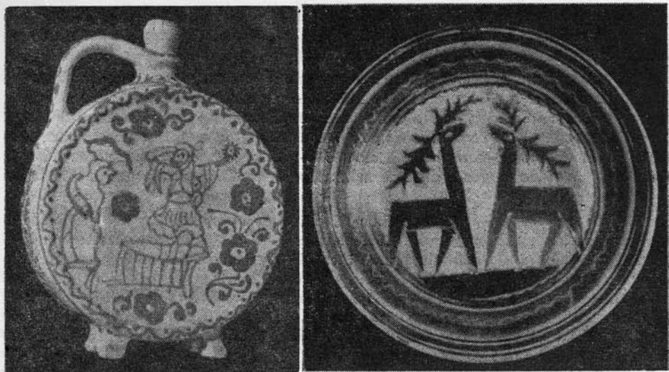
Korondi kulacs és kerámiatál

igen jelentős szerepe volt az 1893-ban alapított szakiskolának, amely Udvarhelyen működött, és nagyon sok korondi fiatal látogatta, akikből később verbuválódott a mázas fazekasság élgárdája. Így honosodott meg Korondon az ipari kerámia.