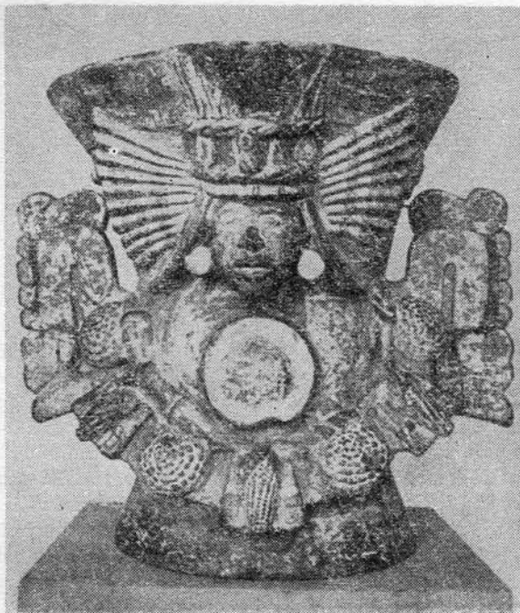
Azték halotti urna

E hosszú koron belül az egyes fontosabb kultúrák szerint több szakasz különböztethető meg (például a Huaca Prieta kultúra i.e. 2500—1300 között, a Guanape kultúra i.e. 1300—840 között stb.). A perui műveltség aranykora időszámításunk első századában köszönt be; ekkor már a szövészet, a festett agyagművesség, a kő és — ami amerikai viszonylatban eddig ismeretlen — a fém feldolgozása igen magas színvonalat ért el, nagyobb városok alakultak ki, templomok, piramisok épültek, és megszilárdult a papi hierarchia. A perui társadalom ekkor már erősen rétegződött: a nemesek, papok, kereskedők uralkodó osztálya mellett ott találjuk a függő helyzetben levő földműveseket is, valamint a teljesen jogfosztott rabszolgákat. A virágkort az ún. expanzió időszaka követte (1000—1300), melynek uralkodó népe az Andok magas fennsíkjain lakott, s amelynek fő kultúrája a bolíviai Tiahuanaco. Ennek romjai mintegy 50 hektárnyi területre terjednek. Hordozói főként burgonya-termesztéssel foglalkoztak, épületeiket hatalmas, tiztonnás és ennél nagyobb kőtömbökből emelték, melyek pontos összeillesztése az ókori egyiptomi technikát juttatja eszünkbe.