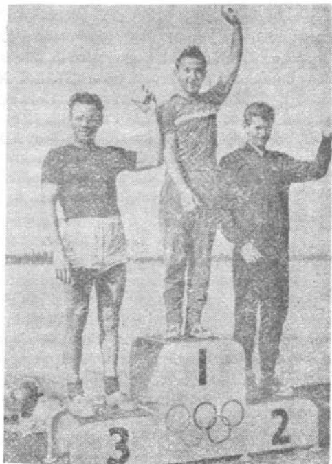
Leon Rottman kétszeres olimpiai kenu-győztes Melbourne-ben