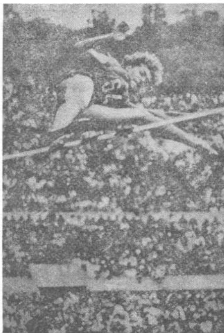
Balázs Jolán, a női magasugrás római és tokiói aranyérmese

1952 emlékezetes olimpiai év a román sportmozgalmában: versenyzőink ekkor nyerték első bajnoki címüket. A fekvő helyzetű kisöbű sportpuskalövésben Iosif Sárbu a 400 lehetségesből ugyanannyi kört teljesítve megszerezte az arany-