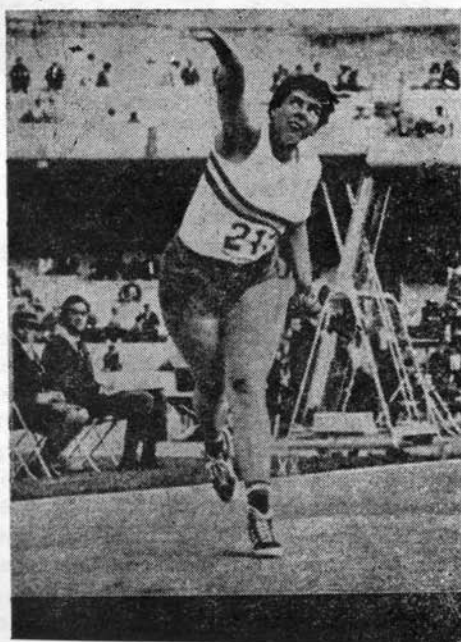
Mihaela Peneş Tokióban gerelyvetésben nyert aranyérmét

Ezen az olimpián rajtolt először a már akkor világcsúcstartó magasugró bajnoknőnk, Balázs Jolán. Túlságosan lámpalázasan versenyzett, és be kellett érnie a képességein jóval aluli, 167 cm-es ugrással szerzett ötödik hellyel. Négy évvel később, Rómában azonban már aranyéremmel kárpótolta magát, akárcsak a lepkesúlyú kötöttfogású birkózó, Dumitru Pârvulescu, aki Melbourne-ben még csak negyedik volt.