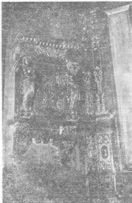
A válaszüti kastély belső díszítése

1921-ben, tél végén gazdám megbízásából Budapestre utaztam, és mintegy