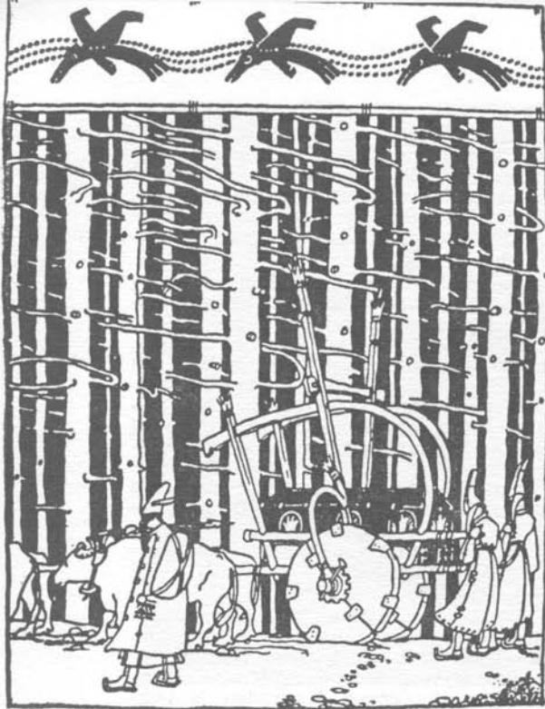
Kós Károly illusztrációja az Atila királról ének című könyvből

luig, és Szucságtól egészen Hunyadig, és keresztbe Középlaktól Gyerőmonostorig. Természetesen ygalogosan, mert így volt a legegyszerűbb (és a fuvar nemcsak feltűnő, de drága is, viszont nekem akkor csak két kis tehencském volt). S hogy találkoztam az emberekkel, bizony mondom, nem sokat kellett magyaráznom. A józan, dolgos, eszes és öntudatos kalotaszegi magyar magától is tudja, hogy „senki szájába nem repül be magától a sültgalamb”, és azt is: „aki pedig nem veszi fel a munkát az életiért, elveszti azt”. De azt sem felejtette még el, hogy a régi Magyarországon a román lakosok is a maguk politikai szervezete útján viaskodtak állampolgári joggyenlőségük kiteljesítéséért, valamint az életmunka minden területén sajátos nemzeti törekvéseik megvalósításáért.