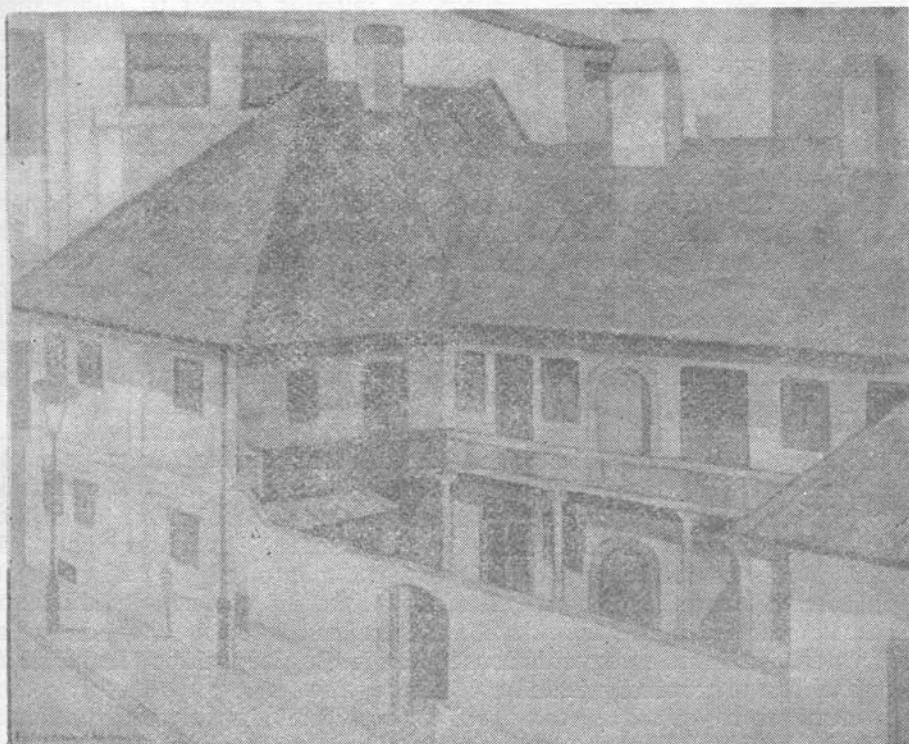
Fülöp Antal Andor: Újhelyi Gábor ötvösmester háza Kolozsvárt (1963)

A szocialista építés jelenlegi szakaszában kialakultak mind a korszerű marxista etika, mind a nemzeti-nemzetiségi kérdés komplex tanulmányozásának kedvező feltételei. Vizsgálódásaink ezekben az összefüggésekben helyezkednek el, az ország egész népét egybefűző szocialista erkölcsi tudat fejlesztésének jegyében.