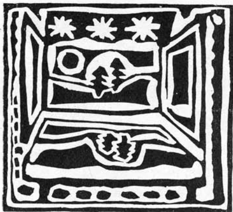
Papp Gábor linómetszete