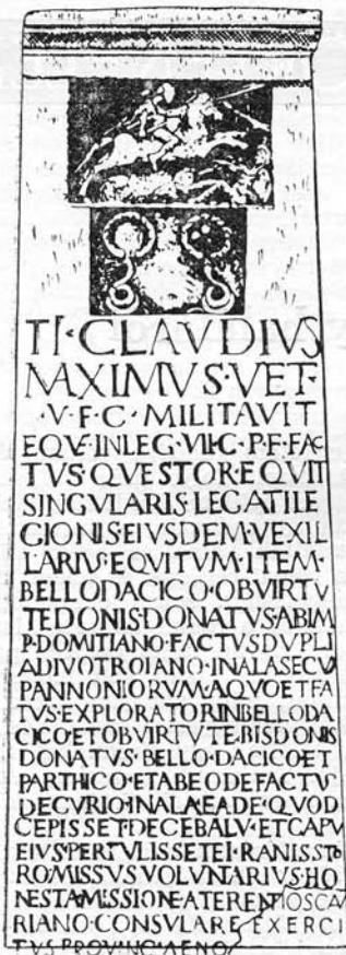
Tiberius Claudius Maximus siremléke

logos vagy lovas) segédcapatokra. A légiók tagjai csak római állampolgárok lehettek, a segédcapatokat a meghódított népekből sorozták, vezetők azonban római állampolgárok voltak. Tagjaik a 20—25 évi katonai szolgálat után a honestia missio , a „tisztességes elbocsátás” alkalmából megkapták a római polgárságot, és ekkor nemzetségnévként a császár nevét vették fel. A Claudius név elárulja, hogy Maximusnak az apja vagy a nagyapja a Iulius-Claudius dinasztia császárai idején (i. sz. 14—68) mint valamilyen segédcapat katonája kapta meg a római polgárjogot.