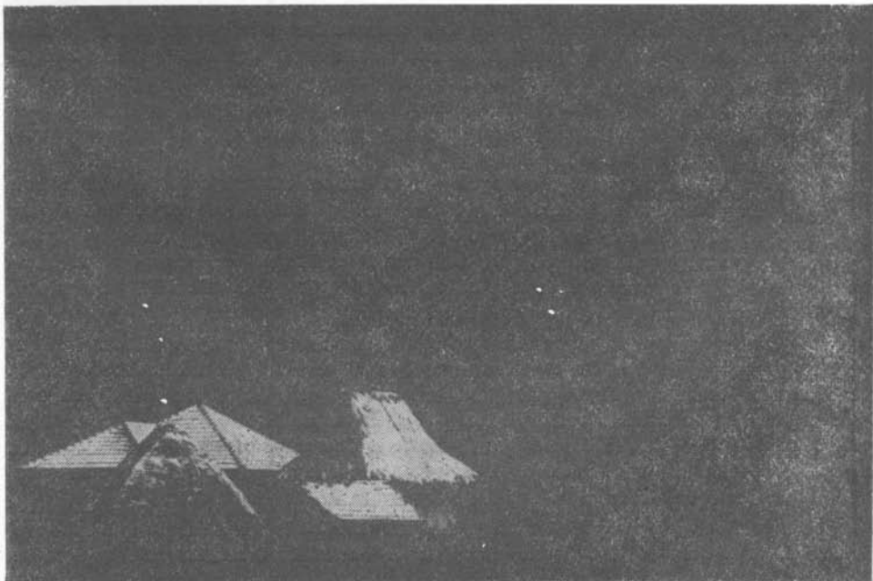
Asztalos Sándor: Piramisok