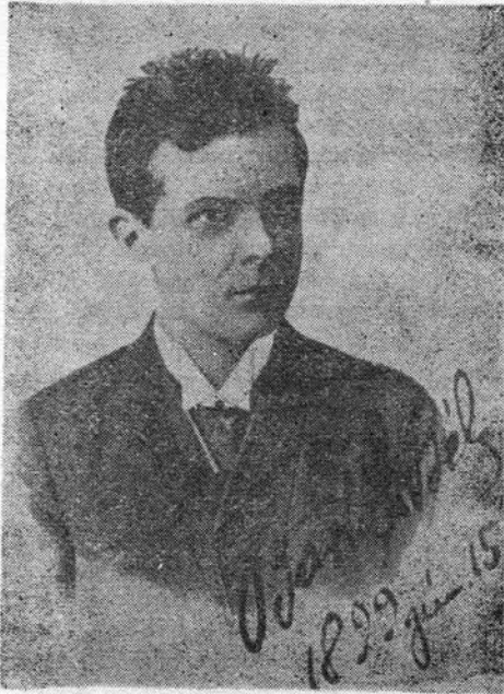
Bartók fiatalkori arcképe

„segédtanár“ és egy kertész működött. Negyedszázaddal 1888-ban bekövetkezett halála után Torontál megye monográfiája mint kiváló elméleti szakembert tartotta számon Gazdasági Tanúgy című folyóirata s két önálló kötete alapján, amelyekben gazdasági szakoktatással s a gazdaságírányítás kérdéseivel foglalkozik. Nagyszentmiklóson Schreyer Zoltán szívessége folytán betekinthettünk a Nagyszentmiklósi Közlöny című lap 1886—1887-es számaiba. Itt több érdekes szakcikket találtunk, melyek szintén id. Bartók Béla tollát dicsérik.