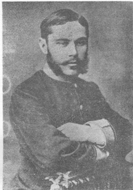
Bartók Béla édesapja