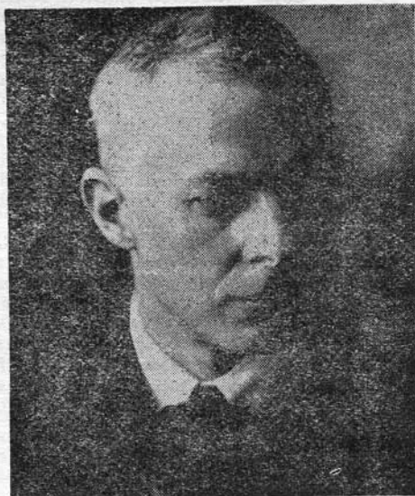
Bartók Béla (kolozsvári felvétel, 1927)