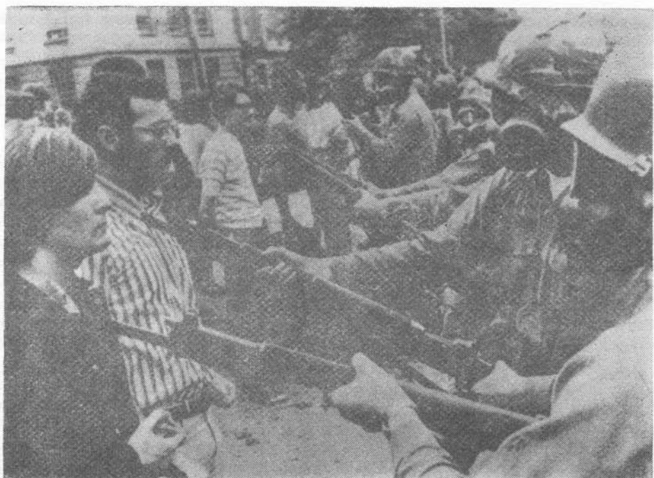
1970. május — az Egyesült Államok egyik egyetemén

a New York-iak érdeklődnek Európa dolgai felől, a San Franciscó-iakat már inkább Ázsia érdekli). A kitűnő hírközlés ellenére észlelhető a világpolitikai naivitás, néha még hétróbás diplomaták baklövéseiben is. (Thomas L. Hughes, a külügyminisztérium kutatási osztályának vezetője egyik írásában rokonszenves önróniával szemlélteti a meg nem értés csimborasszóját: az izraeli—arab konfliktus drámai szakaszában egy ENSZ-beli amerikai diplomata azt javasolta az egymással háborúzó mőzeshitűeknek és mohamedánoknak, hogy nézeteitéréseiket — keresztényi szellemben igyekezzenek megoldani...)