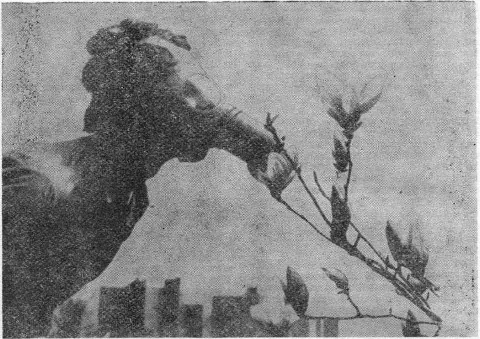
Az egyetemisták a környezet szennyeződése ellen harcba indulnak

mint ezer diákot tudott mozgósítani. Májusban a diákok és a középiskolások részvétele a gyűléseken és bizottságokban számottevő, a mozgalom hatóköre rendkívül kiterjedt. Ezekről a diákoktól és szimpatizánsoktól távol állt az aktív harcosok végsőkig menő politizálása. A forradalmi hevület náluk nem vált el a professzionális célkitűzésektől. A diák-társadalom nemcsak a munkásosztály harcának kiélezéséért mozdult meg, vagy hogy fellázza a népet az uralkodó oligarchák ellen; önmagáért mozdult meg, az egyetemi szervezet s a diákság körülményeinek átalakításáért. De a polgári Egyetem, az oktatás tartalma, a pedagógiai módszerek, a kiüttlanság elleni lázadás és a szelekció-veszély elég élénk és tartós volt ahhoz, hogy beigazolják: napjainkban az egyetem problémái nemcsak kulturális és ideológiai, de anyagi, gazdasági és politikai problémák is. Ilyen értelemben a diákmozgalom egyáltalán nem az „intelligencia” mozgalma, hanem a fiatal munkásoké, akiknek problémái közel állnak a szakiskolák, a tanonc-központok tanulójának problémáihoz.