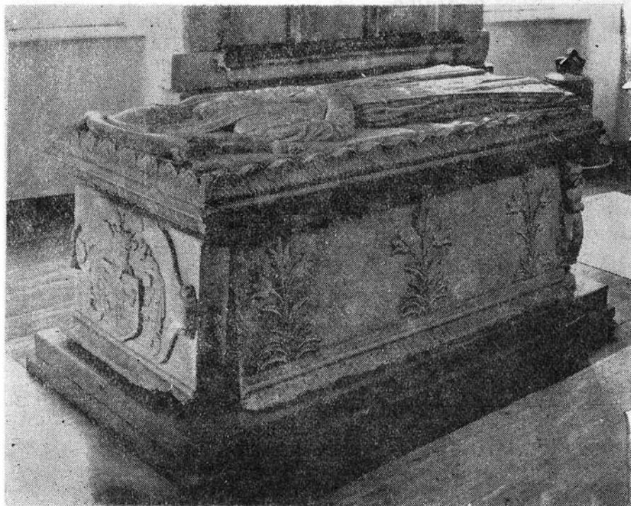
Patócsi Zsófia szarkofágja 1583-ból