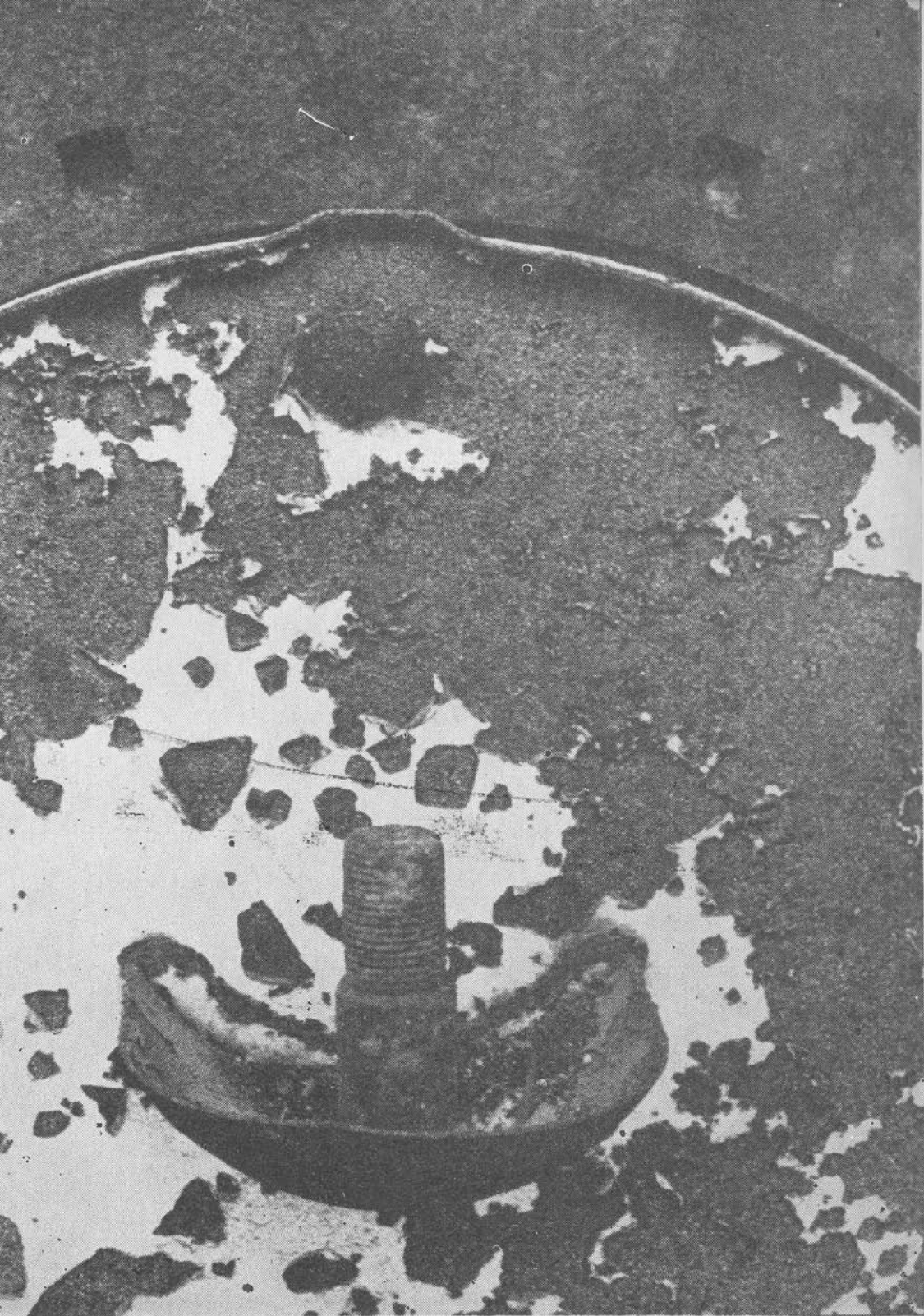
Cast iron mold