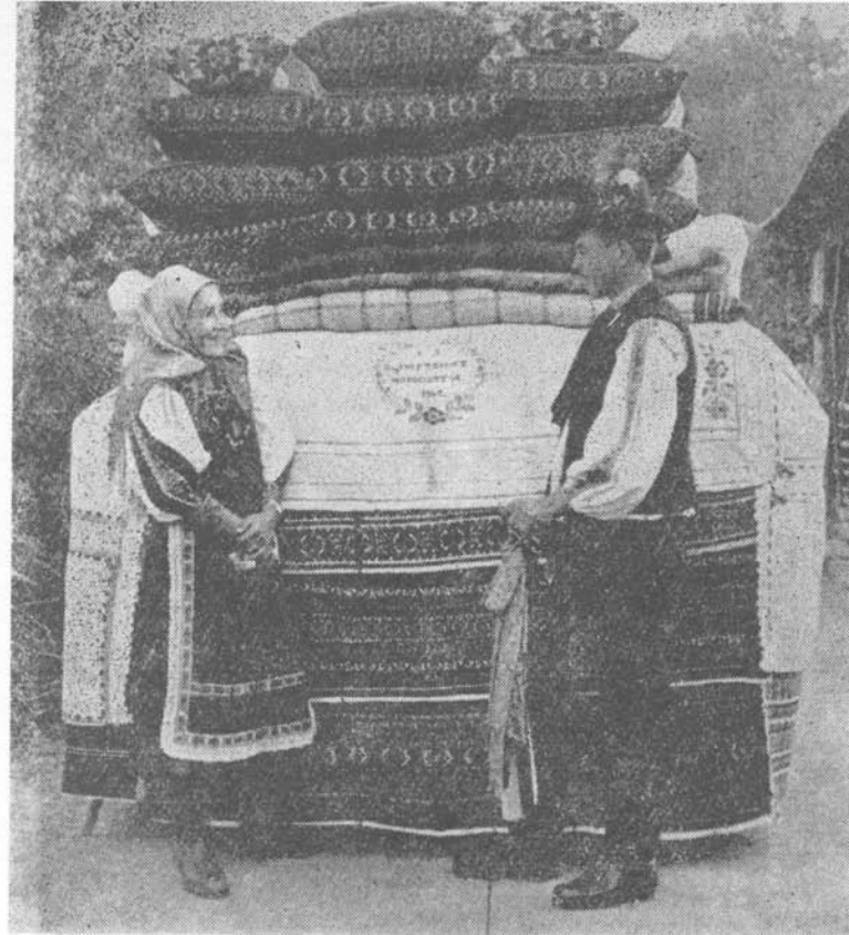
Menyasszonyi kírákodás Györgyfalván

A megkérdezettek egyik csoportja szülő, mégpedig olyanok, akiknek hetedik vagy nyolcadik osztályos gyerekük van. A tanulók szülei megkérdezésével töltötték ki a kérdőívet. A kérdések között a családi házra vonatkozott néhány. Kétszázharmincöt feleletből kitűnt, hogy a válaszolók hatvan százaléka a felszabadulás óta építkezett.