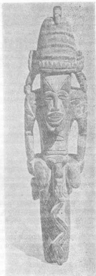
Faragott férfialak (Uj-Guinea)

Bár a gondolat és a fantázia kimeríthetetlen, megfoghatatlan és képtelenségekre is képes, mégis földi ismeretekhez kötött. Egy festmény, hogy igazi mestermű legyen, nem szorul „repülő csészealjnak“ esetleg fantasztikus formáinak segítségére. A maradandó munka szenvedéllyel, tudással készül egy nemes cél érdekében. Kigyalta szellemi erőlködések eredményezhetnek ügyes művészeti tréfát, izgató játékot — sanyargatott idegzetű „műértők“ vagy kollégák kétes öröme, de sohasem lesznek átütő erejű, érvényes műalkotások.