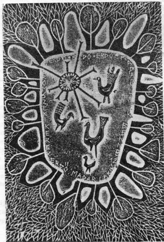
Szócs Agnes metszete