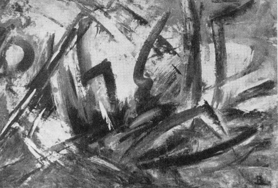
2. Lovas harcos