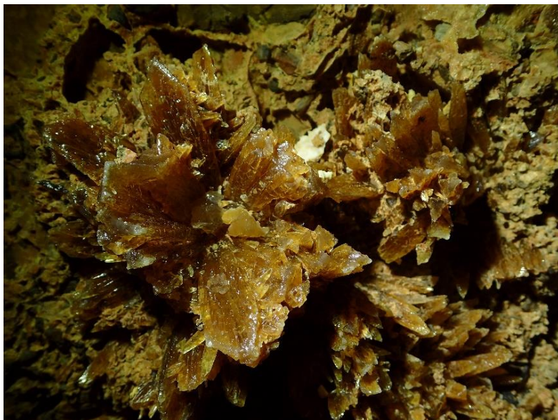
Részlet a Laci-zsombolyból