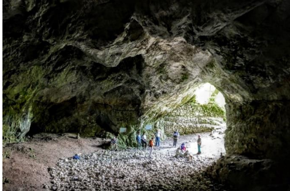
A résztvevők egy csoportja a Szeleta-barlangban

Innen végig mentünk a Forrás-völgyön, útközben megnézve a pataokban a recens édesvízi mészkő kiválásokat. Magyarázat hangzott el erről a kőzettípusról. A fantasztikus, több százéves bükkfa törzsek mellett elhaladva megismerkedtünk a különböző dolina típusokkal, és hazánk legszebb kollapsz dolinájába, az Udvarkő mélyére mentünk le. Innen toronyiránt haladva a hegyoldalban a felszíni karros oldási formákkal (gyökérrak, rácskarr, rillen) ismerkedtünk, majd külön engedélyünk birtokában bejártuk az Udvarkő 1. sz., lezárt barlangot, szintén saját világító eszközeinkkel. Megcsodáltuk a cseppköveket, megnéztük az ásatási helyszíneket, a csontmaradványokat.