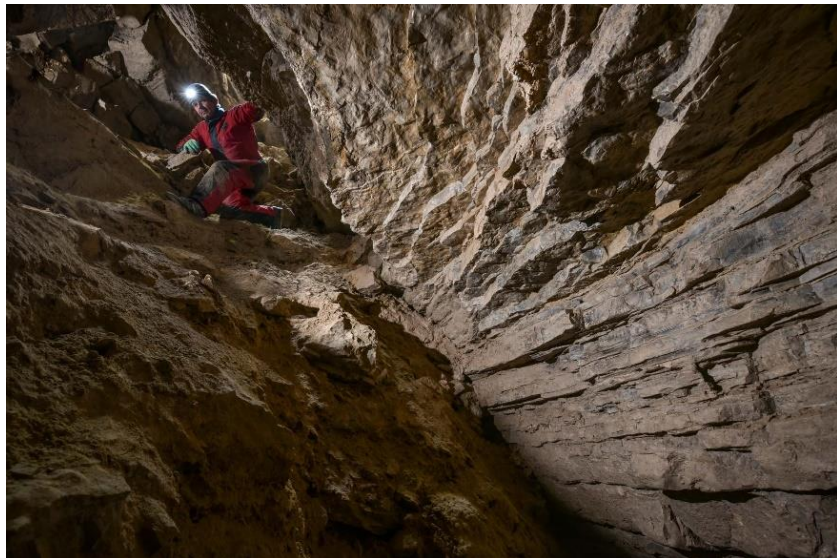
Rezi 1 (R1) – barlang

A barlang jelenlegi állapotában élményszerű bemutatót nyújt ismeretanyaguk, tapasztalati élményeik gyarapítása céljából a környéken túrázó felnőtteknek és gyerekeknek egyaránt, ennek fontossága a környék látnivalóinak (pl. Rezi vár, nyári gyermektáborok stb.) éves szinten nagy létszámú látogatottságában nyilvánul meg.