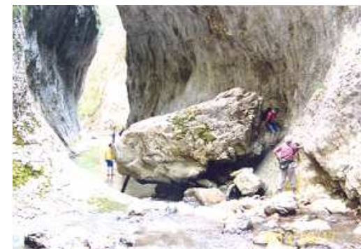
A Remete-szorosban

bejárata. Innen a szoros összeszűkült, s elég sportossá vált a továbbhaladás. A falakon teljesen új drótkötelek segítettek a mászást, de voltak, akik eleve a patakmederben gázolva haladtak előre, szerencsére most nem volt túl magas