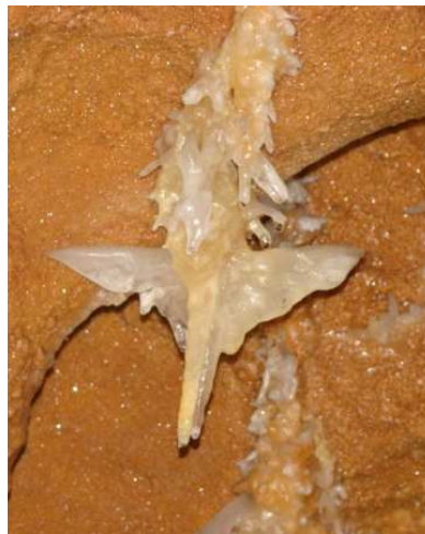
A Farcu-barlang szimbóluma, a Pillangó