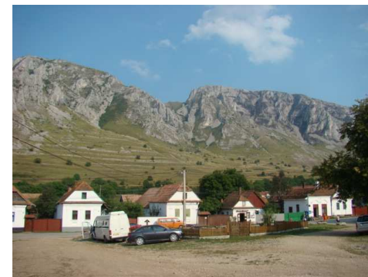
Torockó a felette emelkedő Székelykővel

Harmadik napunkon a szállásunk és Torockó fölött magasodó, 1129 m magas Székely-kő megmászását vettük célba. Még indulás előtt olyan hírek érkeztek, hogy ég a hegy, s esetleg meghiúsul a megmászása, de mi már csak a nagy, feketére égett részeket találtuk a hegyen. A társaság több csoportra oszlott, a legerősebb csapat a csúcsmászás után a gerincen átkelt Torockó-szentgyörgyre, majd az ottani vármotot is felkeresve busszal jött vissza Torockóra. A többiek a csúcsmászás után előbb-utóbb a Forrás Borozóban gyűltek össze,