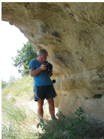
A Kiskő-eresz Tarnaleleszen