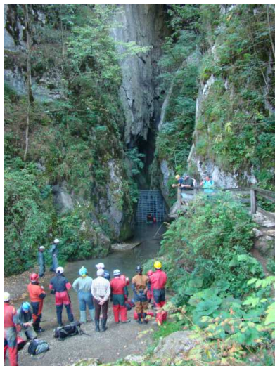
Készülődés a Szolcsvai-búvópatak bejárásához

A Bihar és a Királyerdő közelében haladva, egyre több régi emlék idéződött föl azokban, akik már jártak itt. A környéket nem ismerők pedig azt kérték, hogy ők is hadd részesüljenek ezekben az élményekben, így kezd körvonalazódni egy jövő évi látogatás a Pádisra.