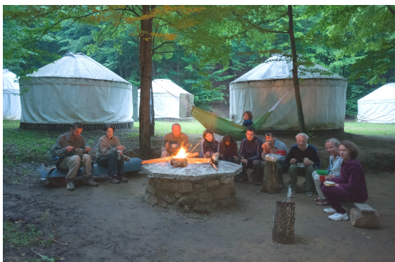
Esti hangulat a jurtatáborban

A tikkasztó hőségben több-kevesebb sikerrel bejártunk hat, sziklafalakat is tartalmazó hegyet. – E tájon, a Vajdavár-vidéken hegyekről, hegységről beszélünk, még akkor is, ha a turistatérképek Őzd-Pétervásárai-dombságnak nevezik. Akik ezt a térképre írták, bizonyára még soha nem voltak e vidéken, ahol a legmagasabb Ökör-hegy 542 m, a Vajdavár hegye is 530 m, és tetemes szintkülönbségek, 80–120 m-es sziklafalak vannak. – E vidék keleti hegyeiben találtunk és megvizsgáltunk négy újabb homokkő-barlangot és meglátogattunk néhány korábban ismertté vált üreget. Az idei barlangkataszterező tevékenységgel együtt már 19 természetes barlang és 10 mesterséges üreg vált ismertté a Vajdavár-vidéken.