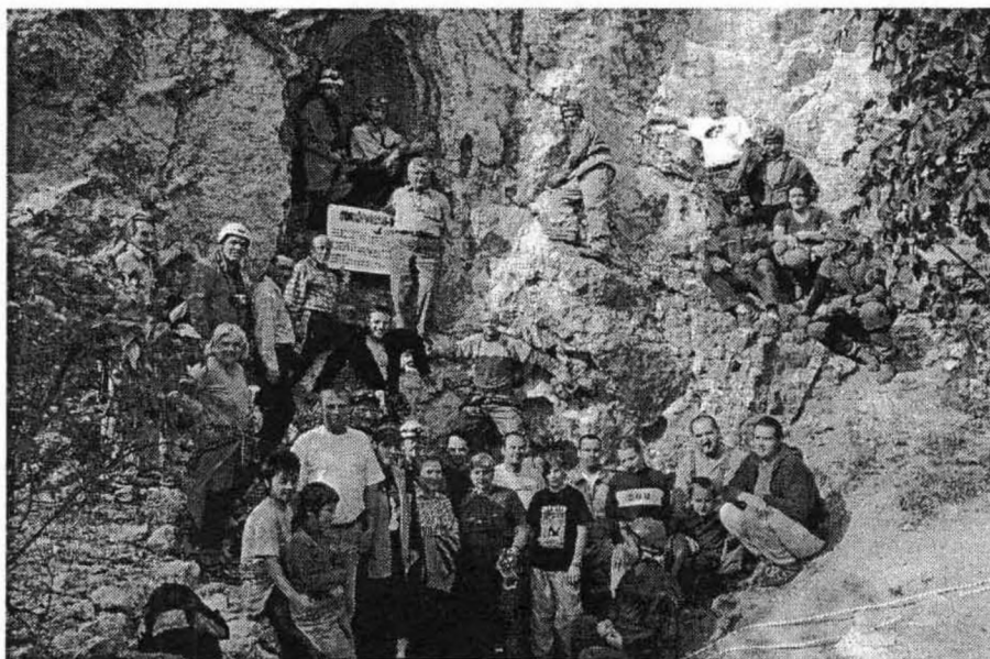
Az ünnepség résztvevői a Sátorkőpusztai-barlangnál