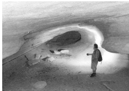
A homokkőben kialakult Ferenc-barlang csarnoka

A Soproni-hegység leghosszabb barlangja az osztrák oldalon (Szent-margitbánya község mellett) levő, lajta mészkőben alakult, 250 m-es Fledermauskluft. A nemkarsztos barlangok közül a viszonylag laza (szarmata ko-rú) homokkőben képződött, hatalmas csarnokokat alkotó – akár lóháton is bejárható – Ferenc- és Ottó-barlangok a legjelentősebbek, valamint kuriózumnak számít a Bánfalvi kőfejtő barlangja, mint az első és ezideig egyetlen magyarországi gneisz-barlang.