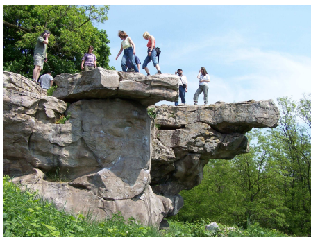
Csoportunk az ingókövön