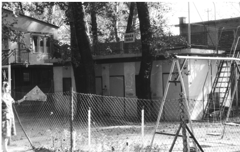
3. kép. A DÉGÁZ üdülője a „Sárgán” az 1970-es években

alkalmazottaikkal végeztettek el, ami nagymértékben csökkentette a költségeket. A problémák akkor kezdődtek, amikor többségük megszűnt, a társulat pedig kénytelen volt csak a tagok által befizetett tagdíjakra támaszkodni. 50