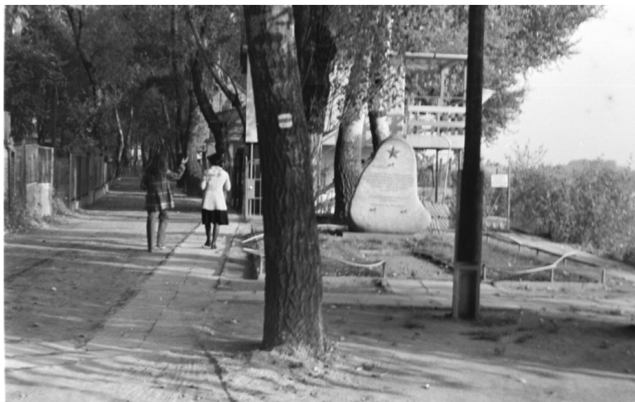
1. kép. A munkásmozgalmi emlékmű az üdülőtelepen az 1970-es években (TIŰi fotónegatívok)

tiszai kavicsot ábrázol, amelyre fémlemezéből kovácsolt, ötágú csillagot illesztettek. Az emlékmű környezetét parkosították, díszkő korláttal vették körbe. A műalkotáson a következő felirat szerepelt, amelyet az 1990-es években ismeretlenek levéstek: „Sárga» Az illegális szegedi munkásmozgalom forradalmi szervezkedésének egyik színhelye az elnyomatás sötét éveiben a párt vezetésével munkások, parasztok, néphez hű értelmiségiek összefogott erővel munkálták itt a szocialista jövőt. Munkásságuk emlékére az utókor nevében Tömörkény István Üdülőtársulat.” A munkástalálkozó emlékezetét az üdülőtársulat próbálta ápolni olyan formában, hogy április 4-ére vagy május 1-jére virágokat ültettek az emlékmű elé. 1974-ben a győzelem napja alkalmából koszorúzásra is sor került, amelyen iskolák, vállalatok és a helyi pártszervezet képviselői vettek részt. 39