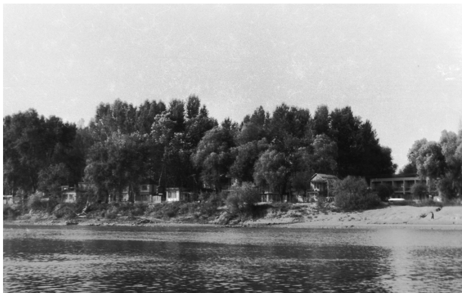
2. kép. Az üdülőtelep a Tisza felől 1970-es években

Nem sok támponttal rendelkezünk arra vonatkozóan, hogy milyen konkrét minták hathattak ösztönző erőként. Olyan típusú üdülőtelep, mint amilyen a két világháború között a Budakalász közelében kialakított Lupa (Lupa)-sziget, Szegeden és környékén biztosan nem létezett. A hullámtérben Apátfalván, Hódmezővásárhelyen, Makón, Mindszenten, Szegváron és Szentesen a 19. század végétől telepített szőlős- és gyümölcsöskertekben voltak ugyan épületek, ám ezek szinte kizárólag gazdasági (munkaeszközök tárolása), nem pedig rekreációs célokat szolgálták. 40 Előképként a strandfürdőkön használatos, különböző méretű strandkabinok 41 jöhetnek számításba, amelyeket a nyári hónapokat követően szétszereltek és elszállítottak a folyó partjáról. Ezt a modellt alkalmazhatták a „Sárgán”, a Tisza hullámterében azzal a különbséggel, hogy az üdülőtelep kialakulásának kezdetekor már állandó építmények is készültek.