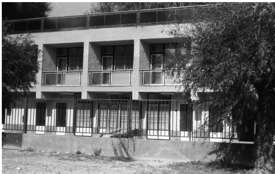
4. kép. A Honvéd üdülő sa tiszai strand mellett az 1970-es években (TIŰi fotónegatívok)

jól nyomon követhetők. A vizuális források mellett a társulat irattárában több olyan kérvény is fennmaradt, amely tartalmazza a felépíteni kívánt nyaralók tervrajzait. A dokumentumokban az 1950-es években az alábbi terminusok fordulnak elő az építményekre vonatkozóan: fürdőház, fürdőhelyiség, fürdőkabin, kabin, nyaraló, üdülőház, strandkabin . Ezek az elnevezések alátámasztják azt a feltételezésünket, hogy mintaként a korábban már más strandfürdőkön használatos épületek szolgáltak.