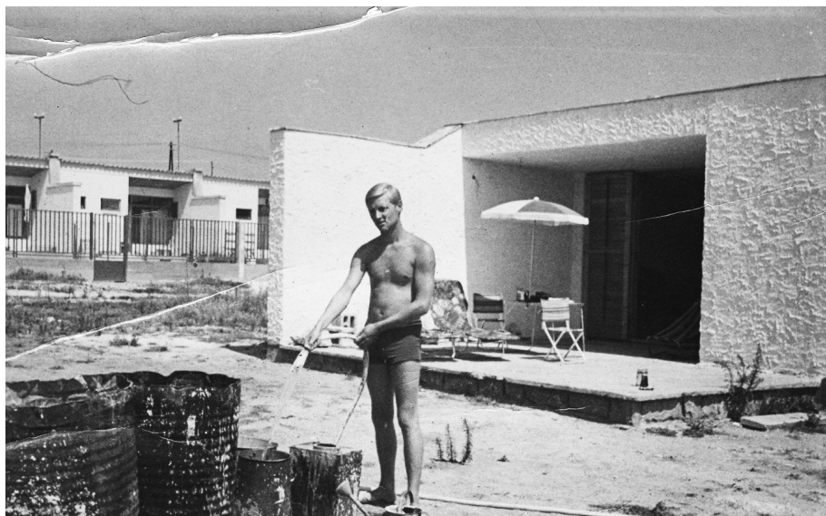
5. kép. Épül a „Gyékény” (a Dévényi család tulajdonában)

„Az építkezéseken kőműves gyakorlatilag csak akkor dolgozott, amikor a falakat felhúzták, illetve a tetőt betonozták. Egyfelől csupán erre volt pénzük, másrészt »nem is volt divat« 85 iparost fogadni.” 86