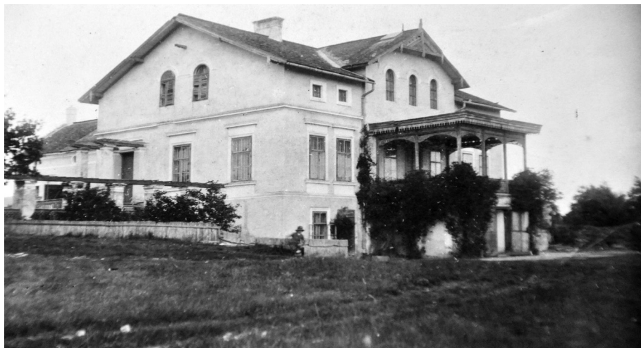
1. kép. A Pántlika-kastély a 20. század első felében (magántulajdon)

meg, vagy az mi módon került az üdülő tulajdonába. Feltételezhető, hogy ennek háttérében a II. világháború miatt elapadó források állhattak. 21