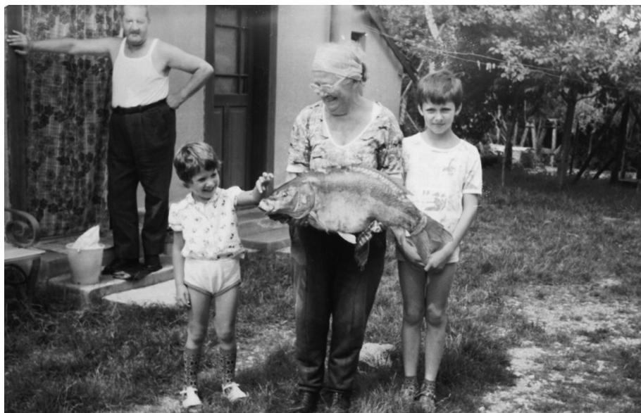
7. kép. Közös fotó az asznapi zsákmánnyal Kemendyék udvarán az 1980-as évek első feléből (a Kemendy család tulajdonában)

bajom sose, az én uram nagyon sok helyen dolgozott.” 115 „Nagyon sok ember jön ide, aki a központi tartalékból tud hozni” 116 – nyugtázta az akkori tanácselnök a településen megjelenő új népesség várható „hozádékát”. 117