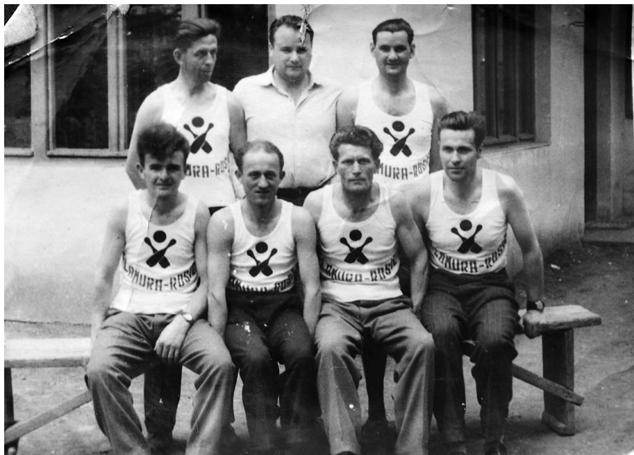
10. kép. A gyár kuglicsapata

csoportja is volt a gyárnak, akik különböző műsoros estéken és hivatalos állami ünnepek alkalmával léptek fel.