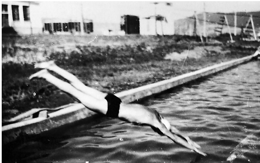
13. kép. Mészoltó gödrökből készült fürdőmedencék

erősítve a mezőgazdaságot. „A magyarok [által] a magyaroknak” építettetett üzem az állami szocialista nagyipar kiépítésének időszakában újabb fejlesztésekkel bővült. Ebben az időszakban épültek fel a gyárhoz tartozó munkáslakások, a gyár kultúrháza, moziterme, napközije, az étkezőhelyisége, a kuglipályája, és ekkor bővült ki a gyár szeszt előállító részleggel. A gyár amellett, hogy a gazdasági modernizációt képviselte, ezzel szoros összefüggésben „szimbolikus termelőhely” is volt, kiemelkedően fontos szerepet töltött be az emberek mindennapi életében. Átalakította a faluképet, létrehozta a gyári munkások közösségi identitását. Kapuján belül egy sajátos társadalmi és közösségi élet formálódott, ahol a munka mellett teret kapott a szabadidő közös eltöltése is: a sport és a szórakozás.