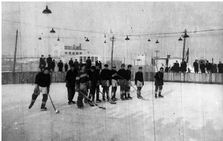
11. kép. Hokimeccs. Háttérben a Keményítő- és Szeszgyár

meg hozzá a fedett pályát. Külön volt férfi és női csapat, akik a munka után egy-egy órás versenyeket tartottak.