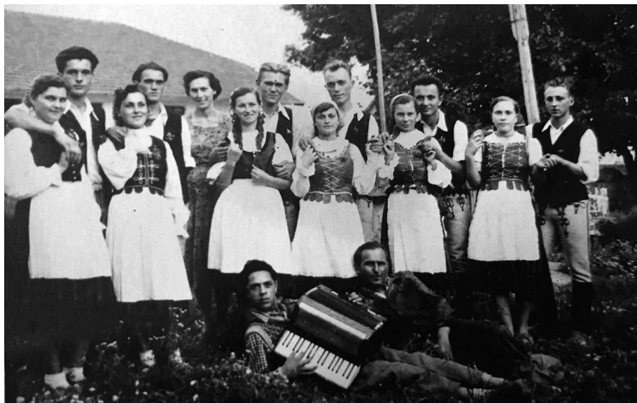
8. kép. A gyár táncsoportja