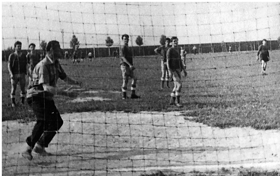
12. kép. Futballmérkőzés a gyár futballpályáján

sem konkrét konfrontáció, sokkal inkább az öröklött paraszti életmód és az újító iparosítási gyakorlat különbségéből adódó, az életmódbeli változásokra adott reflexió volt. A kettős (munkás és paraszti) életforma kritikáját (a falusiak és a gyári fosztok ) elsőként a falubeliek fogalmazták meg. Az üzemen belül szervezett társadalmi, kulturális és sportélet összekovácsolta az ott dolgozókat. A munkaidő lejárta után kezdődő események megteremtették a szabadidő eltöltésének szociális módját. Az üzemi munkások idejük legnagyobb részét a gyár területén belül vagy a gyári munkások közösségében töltötték el. A gyárban dolgozók jelenből értelmezett múlt rekonstrukciójában nem jelenik meg hiányérzet.