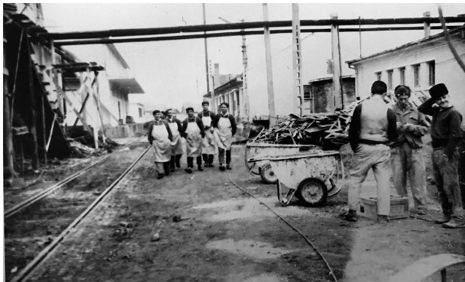
1. kép. Vasút a gyár udvarában

zésére engedélyezett kölcsönt a község nem vehette fel, 29 mert a község ez irányú kérelmét a pénzüzetek elutasították.” 30