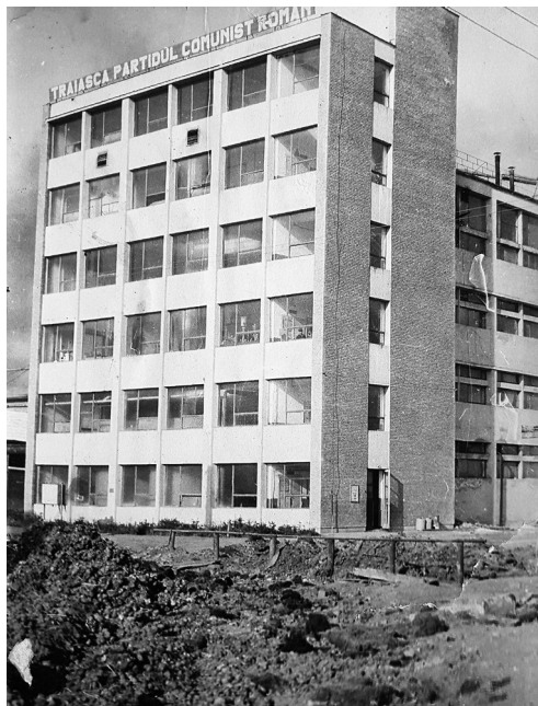
6. kép. Épül a szeszgyár (A szerző gyűjteménye)

gonya nagy részét. Az 1971-es szeptemberi napi hírek szerint például Alcsíkon felkészültek a burgonyatermés átvételére: