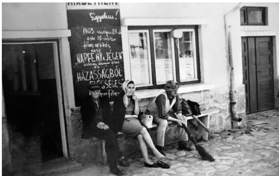
9. kép. A gyár mozija, 1965

ségnek számított. „A szövegekönyveket elvették, és kihúzásokkal, a tartalmak teljes cenzúrájával adták vissza megtanulásra” – emlékezik vissza K. G.