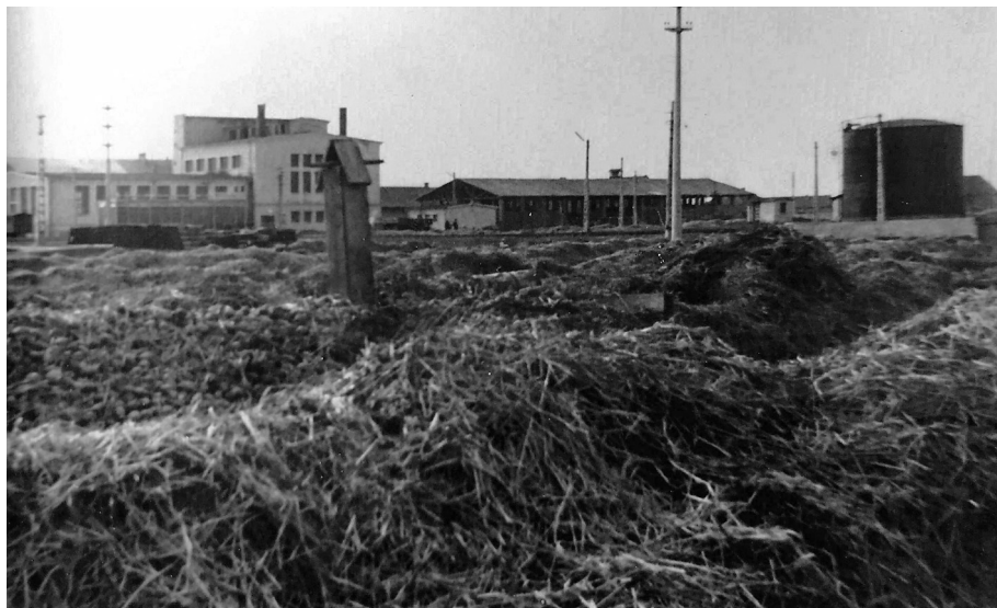
2. kép. Burgonyavermek szellőzőlyukakkal

A beérkező termést a minőségi ellenőrzés után vagy felhasználásra, vagy tartalékolásra küldték. Ősztől kezdődően a tavaszi hónapokig, általában márciusig a burgonyát vermekben tárolták. A faluhoz közeli, Súgászó nevű erdős helyen található kőbányából szekerekkel hordták a követ, hogy a vermek között megfelelő erősségű köztes utakat készítsenek. Körülbelül négy-ötszáz vermet ástak, és a 30×4×0,5 m méretű vermekben öt- és hatezer tonna burgonyát tartalékolnak. „Öthektárnyi területen csak a vermek voltak, s mindegyikbe egy vagon pityóka fért bele” – pontosított J. F.