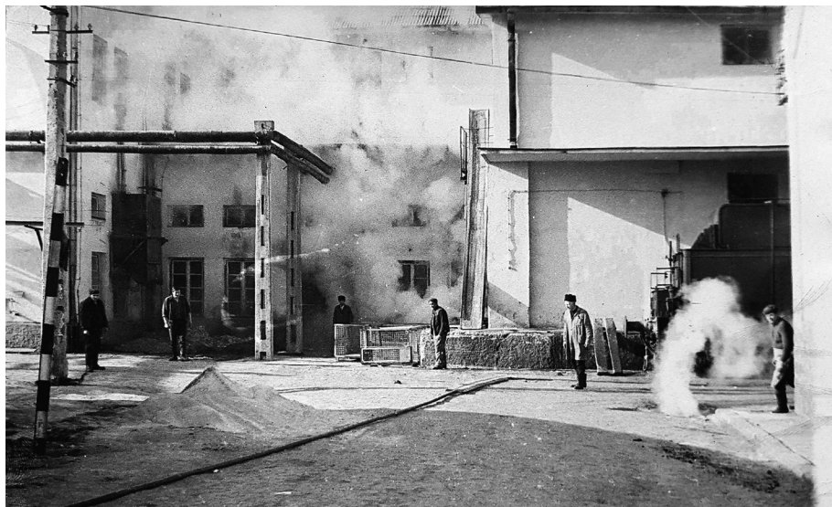
7. kép. Keményítőgyár udvara, a csomagoló épülete előtt