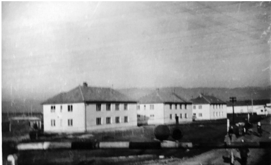
4. kép. 1962-ben épült munkáslakások

kát vállaljanak. Megfelelő számú otthon kellett teremteni az egyre több munkás részére, így épültek meg a gyár kapujától elindulva, végig az Állomás utcán az egyemeletes, hat lakrészes otthonok. A munkáslakások lakói minimális bérleti díjat fizettek, a lakbér ára a hatvanas-hetvenes években havonta hatvan lej volt, az átlagfizetés pedig ezerkétszáz-ezernyolcszáz lej. Emellett a gyártól kiépített gőzrendszeren keresztül ingyen kapták a fűtést és a melegvíz-ellátást. Az itt lakókat a falubeliek „blokkosoknak” hívták, mivel ők nem dolgoztak a kollektív gazdaságokban, nem jártak ki a mezőre, nem tartottak állatokat, és volt állandó fizetésük, biztos megélhetésük. 40 „Más életmódot éltek, szinte mint a városi, s a falusi ember szemével nézve ők a falusi életet megtagadták.” (H. G.)