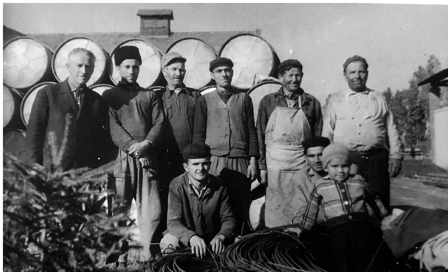
3. kép. Hordókészítők

udvarán. Szekerekkel és kocsikkal álltak sorban, hogy részesüljenek belőle. Így a távolabbról érkezők, például a gyimesi hágón átutazó gazdák már előző este elindultak, hogy reggelre Csíkszentsimonba érkezzenek a kóboros szekerekkel. 34 Sokszor a faluval szomszédos, Csíkszentmárton felőli határig ért a sor. Éjszakánként szénából raktak tüzet az út menti árkokban, ami napfelkelteig fényt és meleget adott. Akik a falunak azon a részén laktak, visszaemlékeznek, hogy esténként az ablakból nézték, vajon meddig tart a mezőben a szekérsor. L. M. szerint abban az időben „olyan kapu nem volt, hogy ne tartsanak állatot, mindenki dolgozott s magát lefoglalta, aki ügyes volt, szerelt innen csírárt és malátát, s ez csak az volt, amit a gyár adott”.