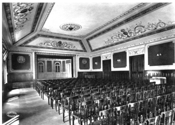
A somsályi Olvasó színházterme. Somsálybánya, 1904