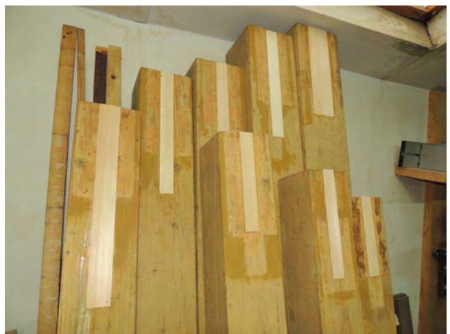
13. kép. A sípokon kivágott részek fa pótlásai