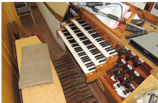
6. kép. A hárommanuálossá alakított játszóasztal. Tetején a háttérben az eredeti két billentyűsor közül leszerelt felíratos tábla