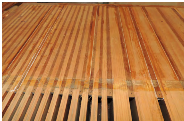
8. kép. Az egyik szelláda restaurálás közben

2. A korábban különböző zenei igények kivitelezéséhez három manuálossá alakított játszóasztalt helyreállítottuk a Kolonics által megépített két billentyűsoros (manuálos) formájába. A regiszterpulton csak az eredeti húzók maradtak, azokat a regisztereket, amelyek a bővítés során kerültek a hangszerbe az orgonista bal oldalán külön helyeztük el.