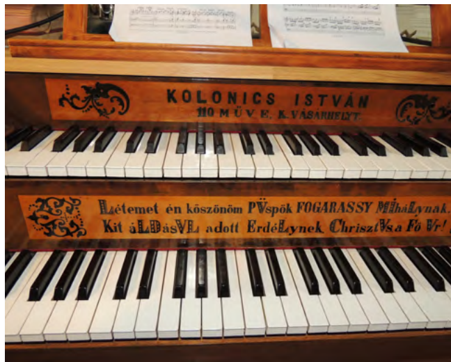
4. kép. Feliratok a manuálok fölött. Fent: a mester neve és az orgona sorszáma, lent: a készítés idejét tartalmazó szöveg. A felvétel az újrestaurálás után készült