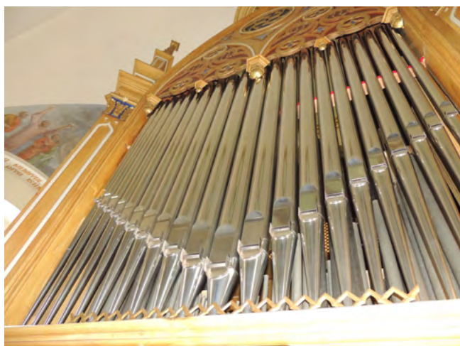
7. kép. Az orgona rekonstruált homlokzati Principal 8' sípsora