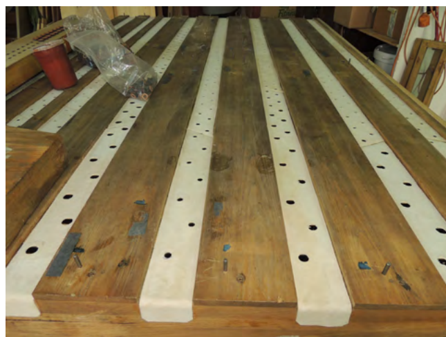
9. kép. Börözött kancellás megoldás a szelládán