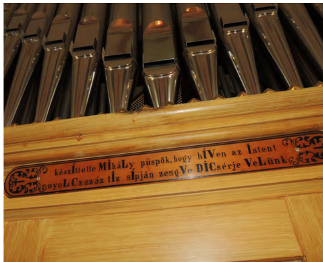
5. kép. Felirat az orgonaszekrényen

Az orgonát az idők folyamán többször átépítették, illetve kisebb nagyobb változtatásokon esett át.