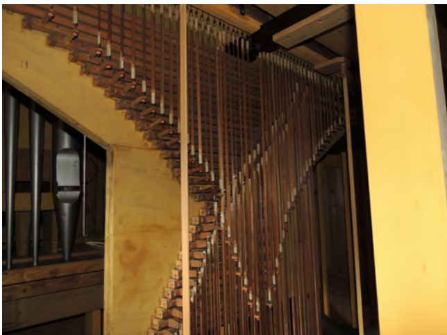
11. kép. A felújított hangmechanika

A korábbi átalakítás miatt eltávolított feliratos táblát a játszóasztal helyreállítása után visszahelyeztük eredeti helyére, a két billentyűsor közé (4. kép).