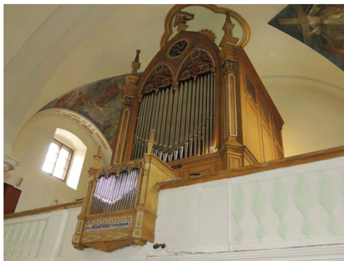
1. kép. A gyergyószentmiklósi római katolikus templom Kolonics orgonája

Romániában több orgonafelmérés készült 1 , mely felfedte, hogy több mint ezerötyszáz orgonát tartunk számon, és hogy ezt az állományt jó harmadban értékes történeti múltú orgonák alkotják. Bár e hangszerkincs túlnyomó része szerényebb méretű és kiképzésű falusi orgona, összességükben azonban műveltségünk, zenekultúránk történetének színes, hiteles képét tárják elénk. Ha leszűrjük körzönket térképünkön Székelyudvarhelyen, és húzunk egy 25 kilométeres kört, ezen körön belül 112 darab értékes orgonát találunk, s ez egyedülálló módon egy élő múzeumot biztosít a látogató számára. Az orgonák számát megnöveli Udvarhelyszéken az a tény, hogy aránylag kis falvakban is három felekezet három templommal és orgonával képviseli magát. Mivel Csíkszék, és Gyergyószék nagyrészt katolikus maradt, ott kevesebb orgonát találunk, Csíkszéken ötvenháromat, Gyergyószéken csupán tizennyolcat. Ez utóbbiak közül jelen tanulmányban egy szép alkotással ismerkedhetünk meg (1. kép), amelyet Gyergyószentmiklós szülöttének, Fogarassy Mihály püspöknek tiszteletére készített a szabadkai születésű Kolonics István mester 2 , aki Fogarassy hívására költözött Kézdivásárhelyre, és innen gazdagította Erdély orgonáskertjét közel kétszáz, időt álló orgonával (2-3. kép). 3 Kolonics első erdélyi orgonáját, a nagyenyedit 1855-ben – egyes források szerint még Szabadkán – készítette, míg az utolsó, százkilencvenkilencedik építése közben 1892-ben Csíkszatószezen hunyt el. 4