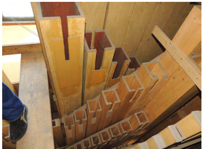
12. kép. Az átalakítás során ejtett mély bevágások a sípokon