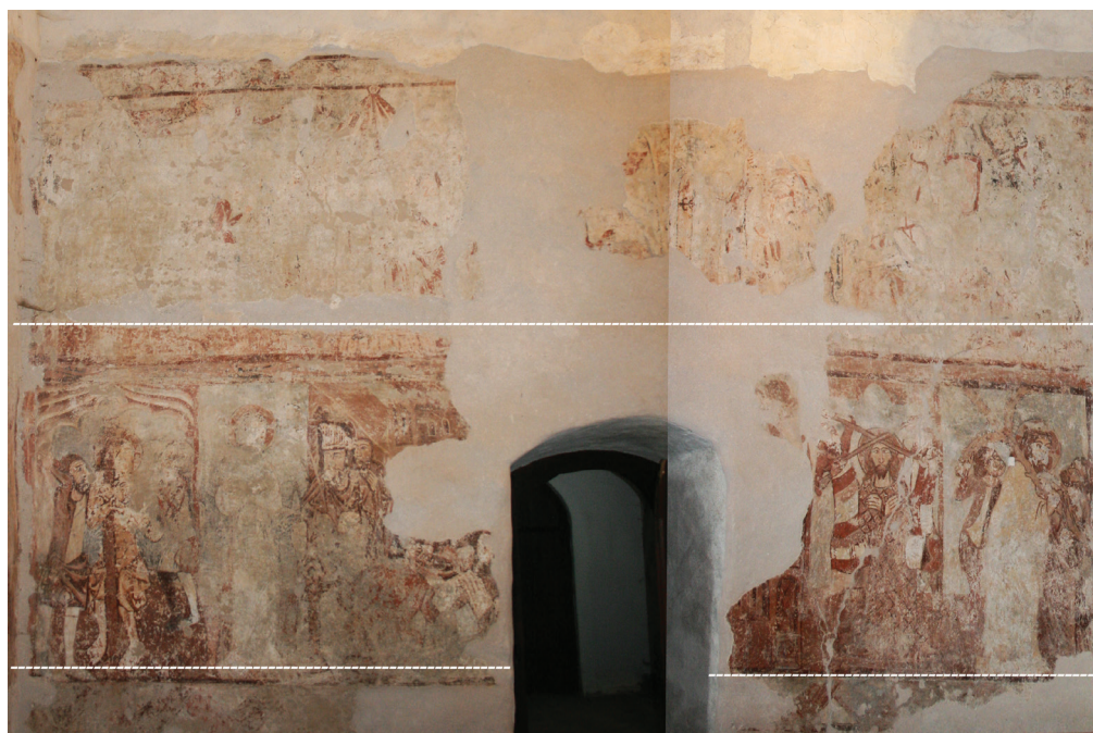
14. kép. A templomhajó nyugati oldala, ---- állványszintek. A felső regiszterben a Szent László-legendá indítójelenete van, alatta pedig a Passió jelenetei folytatódnak.