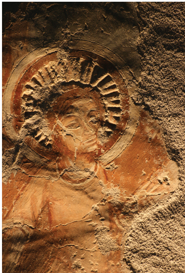
9. kép. Súrlófényes felvétel a Mennyország kapuja alatti falkép töredékről, részlet.

széle benyúlik a felső regiszter vakolata alá (8. kép). Ez a töredék a szakirodalomban jegyzetekkel ellentétben nem későbbi kifestés, hanem korábbi. 15 A töredéken a vakolat elsimításának eszköznyomai nehezen észlelhetők. A képmező kijelölésére itt is kicsapózsineget használtak. A kompozíciót okker színnel vázolták fel. Előkarcolás nyomai csak a glória dupla körvonalánál észlelhetők. A glória belső kialakítása eltérést mutat a fenti regiszterhez képest. A glória közepétől kiindulva sugárszerű vájatokat mélyítettek a vakolatba, ezt követően színezték. A vájatok szélei legömbölyítettek, a mélyedésekben pedig, ugyan megkopott, de látható a festékréteg. Ez arra enged következtetni, hogy a glória mintázott részét még a nedves vakolatba formálták meg (9. kép).