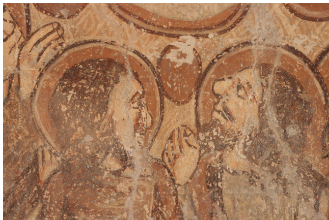
7. kép. Részlet az Utolsó vacsora jelenetéből.

A glóriákat sötét okker színnel telibe festették, majd egy fehér és egy sötétbarna sávval körülhatárolták. Az arcoknál egységes kialakításra lehetünk figyelmesek. Világos okker színnel festettek egy alapot. Az orr vonalán, a szemöldök alatt és az áll mentén sötétebb okker színnel jelölték az árnyékos részeket. A barnás, kör alakú arcpír a járomcsontokon jelenik meg. Az arc kiemelkedőbb részeit nem hangsúlyozták csúcsfényekkel. Legvégül az arc körvonalát húzták meg sötétbarna színnel, valamint az orr, a száj, a szem és a szemöldök vonalát. A haj kivitelezésénél sötét alapot használtak, majd mésszel, hullámos csíkokkal modulálták (7. kép).