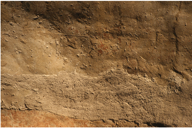
3. kép. Kicsapózsineg nyoma a vakolaton, surlófényes felvétel.