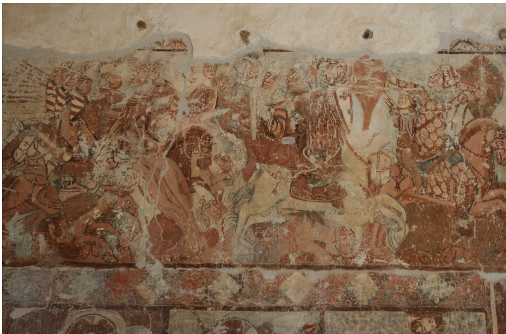
16. kép. Részlet a Szent László-legenda Ütközet és Üldözés jelenetéből.