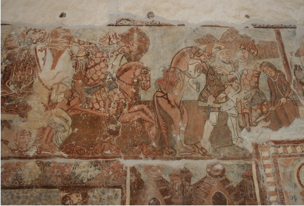
27. kép. Részlet a Szent László-legendája jeleneteiből.