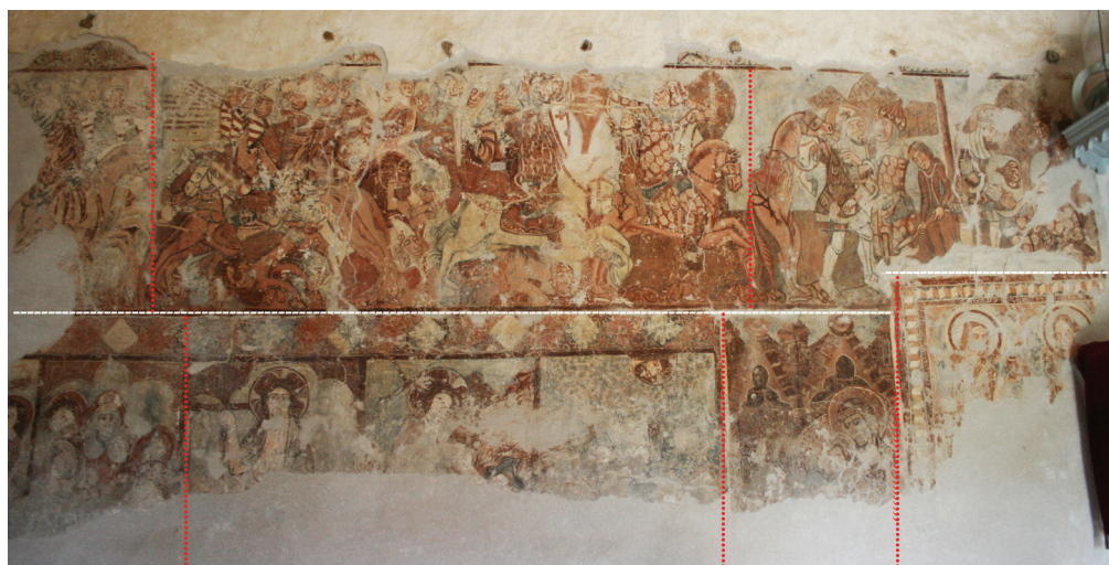
15. kép. A templom északi oldala: ---- állványszintek, ..... függőleges vakolathatárok. A felső regiszterben a Szent László-legendá folytatása látható, alatta a Passió jelenetei. A képciklus végén egy Mária gyermekével jelenet, feltehetően egy donátor ábrázolása van, mellette pedig külön vakolaton a két orvosszent, Kozma és Damján alakjai.

Az ezt követő szakasz mintegy 360 cm hosszúságban az ütközetben részt vevő kun sereget mutatja be, valamint az Üldözés jelenetéből Szent Lászlót a lován. A harc középpontjában a lándzsák záporozását láthatjuk. A kun katonák hasonlóan tömörülnek, akárcsak a magyar vitézek. Itt az arcok is jó állapotban megmaradtak. Megfigyelhető, hogy kifestésük nem különbözik. A katonák viadaltól kipirosodott orcáján erőteljesebb vörös foltként jelentkezik az arcpír. Nem különböznek egymástól sem karakterükben, és szinte mozdulataikban sem. Az előtérben egy félig takarásban lévő, a sereggel ellentétes irányban álló ló, valamint egy-két elhullott katona töri meg a jelenet egységét. A lovak mindegyike hasonló helyzetben áll, különbség csak a színükben és mozgásirányukban mutatkozik. Az Üldözés jelenetén a Szent László mögött hadakozó ma-