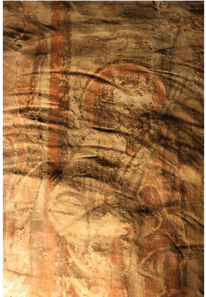
11. kép. Részlet a Júdás csókja jelenetből: a surlófényes felvételen, a jelenethatáron túlnyúló eszköznymok kontrasztos képe látható.

A Mária-ábrázolás vakolata is követi a fal egyenetlen vonalát, de nem jelentkeznek rajta markánsan a simítás-hoz használt eszköz nyomai. A képmezőt vörös színnel, ecsettel jelölték ki, segédeszközt nem használtak. Az ábrázolás kopottsága miatt nem figyelhető meg a részletek kidolgozása, viszont itt is felállítható a feljebb leírtakkal azonos festési sorrend. Előbb a háttérrel és annak architektonikus elemeit festették meg, majd a figurákat és azok részleteit. Mire a részletek kifestésére került sor, feltehetőleg meglehetősen száraz lehetett a vakolat, ezért csak