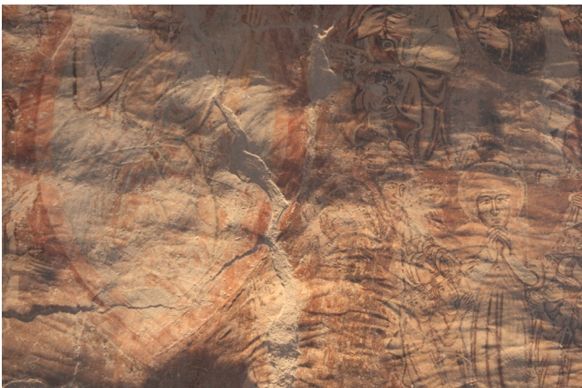
4. kép. Alákarcolás vonalai az Utolsó ítélet jelenetén. Részlet, surlófényes felvétel.

A jelenetek felvázolására okker színt használtak. A megkopott festékrétegek alól kilátszik az ecsettel felrajzolt alárajz. Ezt követte a kifestés. A szürke háttérrel és az okkerszínű talajjal kezdték a munkát. A jelenetet lezáró alsó és felső díszítőkeret is a festés elején készülhetett, mert ezek kevésbé kopottak, jó megtartásúak, azaz a vakolat még meglehetősen nedves lehetett. A glóriák pereme benyúlik a díszítőkeret sávjára.