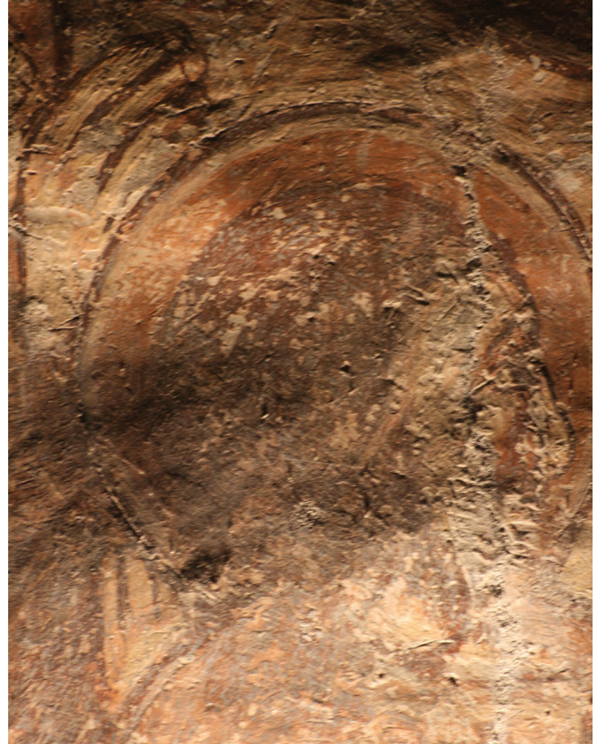
5. kép. Részlet az Utolsó vacsora jelenetéből: a glória körvonalainak bekarcolása, valamint a körző leszúrási pontja. Surlófényes felvétel.

A jelenetek felvázolására okker színt használtak. A megkopott festékrétegek alól kilátszik az ecsettel felrajzolt alárajz. Ezt követte a kifestés. A szürke háttérrel és az okkerszínű talajjal kezdték a munkát. A jelenetet lezáró alsó és felső díszítőkeret is a festés elején készülhetett, mert ezek kevésbé kopottak, jó megtartásúak, azaz a vakolat még meglehetősen nedves lehetett. A glóriák pereme benyúlik a díszítőkeret sávjára.