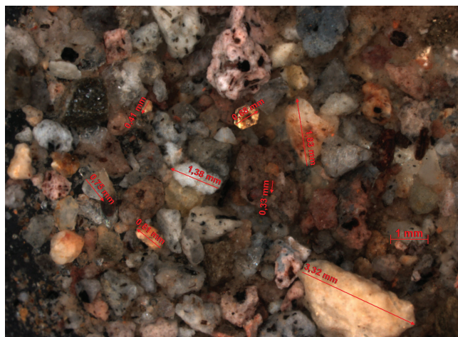
22. kép. A Szent László-legenda vakolatából készült homokfrakció sztereo-mikroszkópos felvétele.

A Mária gyermekével jelenet, a kosarat vivő szent alakjának, valamint az északi oldalon a két orvosszent ábrázolás vakolatának mintáiról megállapítható, hogy a vakolatokhoz felhasznált töltőanyag vulkáni eredetű, akárcsak az Utolsó ítélet és Passió jeleneteinek vakolatáé. A templom déli, külső falképeinek vakolatösszetétele megegyezik a templomhajó belsejében található falképek zömével ( Utolsó ítélet , Passió jelenetei, Szent László-legenda ).