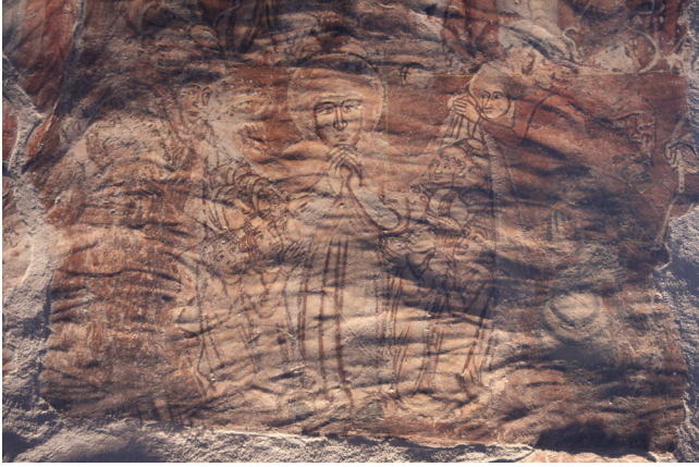
2. kép. Részlet az Utolsó ítélet jelenetéből: eszköznymokkal sűrűn barázdált felület. Surlófényes felvétel.