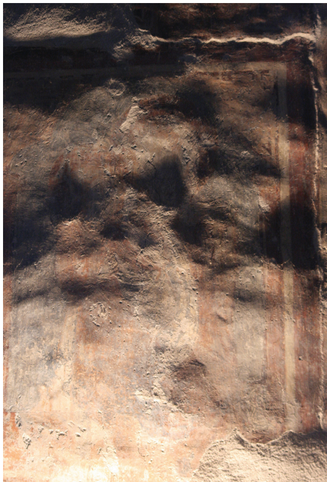
29. kép. A Mária gyermekével jelenet vakolata követi a fal egyenetlen vonalát, azonban a mellette lévő kifestéssel ellentétben felülete eszköznyomokkal sűrűn nem barázdált. Sűrűfényes felvétel.

kifestés módja eltérést mutat. Az arc világos rózsaszín alapjára kerültek seprűszerűen elterülő vonalkás sötét árnyékok. A mésszel festett csúcsfényekre is ez a vonalas megjelenítés jellemző. A kontúrok jelen esetben is hangsúlyosak és erőteljesekek.