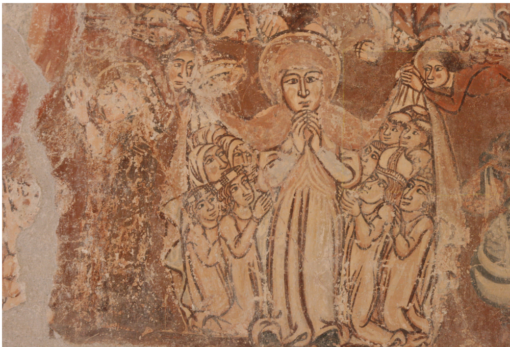
25. kép. Köpönyeges Mária, részlet az Utolsó ítélet jelenetéről.