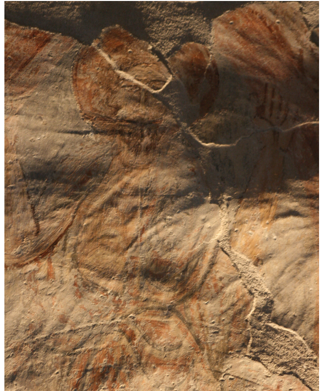
6. kép. Részlet az Utolsó ítélet jelenetéből: Krisztus teste közepén kereszt alakú szerkesztővonal látható. Surlófényes felvétel.