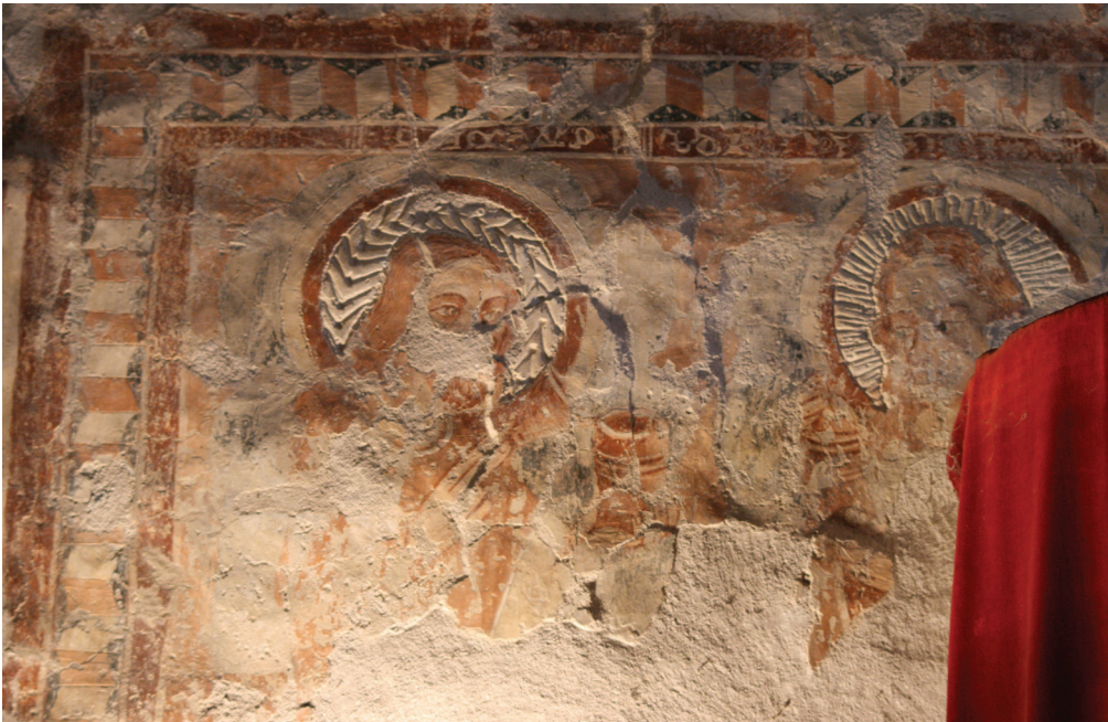
19. kép. Északi oldal, Szent Kozma és Damján jelenete: a surlófényes felvételen az előkarcolások nyomai is láthatóak.

tagolások a jeleneteket elválasztó keretekre kerültek, eldolgolásuk meglehetősen alapos. Az első, 280 cm-es vakolatszakszon három jelenet látható: Keresztre feszítés , Levétele a keresztről és Krisztus siratása . A következő szakasz szintén három jelenetet foglal magába mintegy 300 cm hosszúságban: Feltámadt Krisztus , Krisztus Pokolra szállása és Krisztus megjelenése – Szent Pál megtérése . Ezt egy 110 cm-es vakolatszaksz követi Mária gyermekével ábrázolással. Az utolsó jelenet, melyen a két orvosszent Kozma és Damján alakja látható, szintén külön vakolatra készült. A 140 cm széles és 180 cm magas vakolatot felhordása után elsimították, de nem egyenlítették ki, követi a fal síkjának domborulatait. Ezt a falképet a felsorolt jeleneteknél hamarabb festhették meg, mert felső