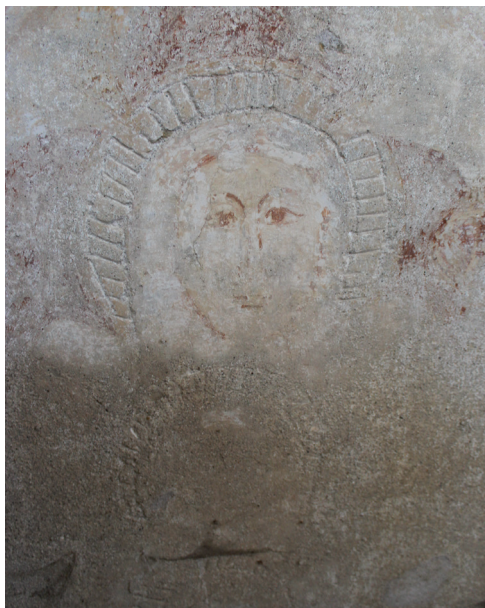
20. kép. Falkép töredék a templom déli oldalának külső falán.