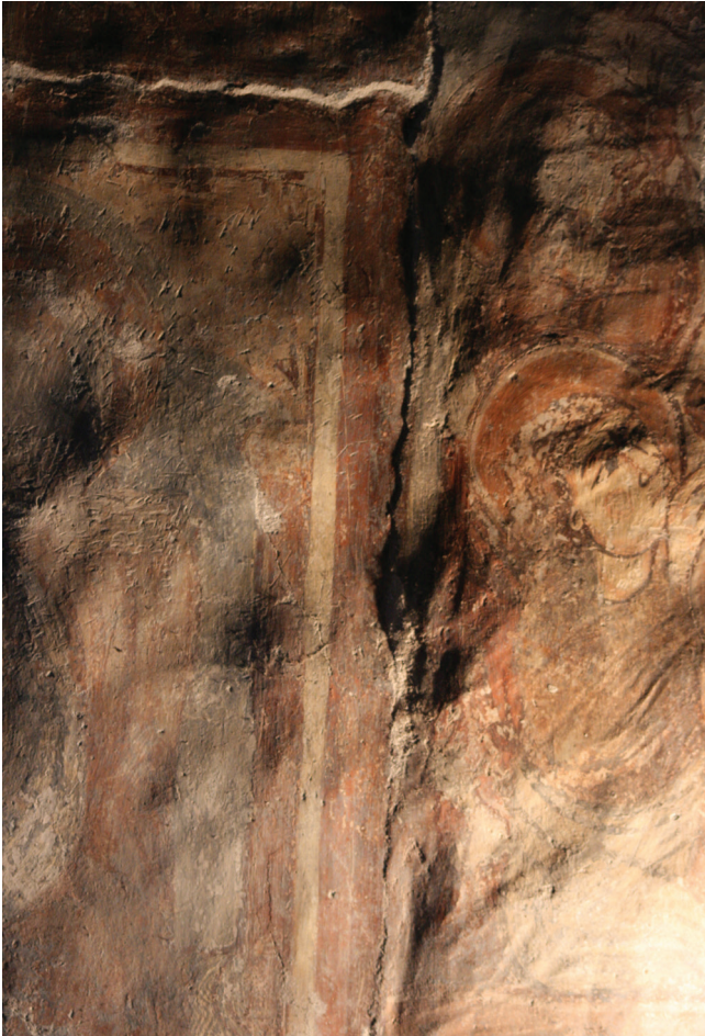
10. kép. A Mária gyermekével jelenet vakolata benyúlik a körülötte lévő ábrázolások vakolata alá. Részlet, surlófényes felvétel.

sze. Nincs kizárva, hogy az ajtóbéllet valamikor festett volt. A megmaradt töredéken a kifestés – a spatulanyomokkal sűrűn barázdált vakolat – megegyezik a fölötte lévő Utolsó ítélet jelenetével.