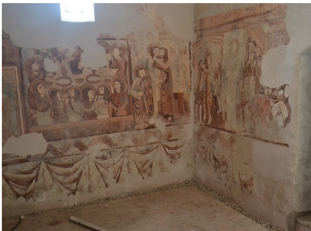
13. kép. Déli és nyugati oldal középső regiszter, részlet. Balról jobbra: Utolsó vacsora, Júdás csókja, Krisztus elárulása és elfogatása, Krisztus megostorozása, Krisztus bírái előtt. A jelenetek alatt a lábazati részen drapériamotívum húzódik.

A Szent László-legenda indítójelenetének vakolatmagassága 170 cm (14. kép). A vakolat elsimítása pontosan úgy történt, mint a déli falon. A középső regiszter jeleneteiből sokkal több maradt fenn. Csak az alsó és felső vakolathatárok láthatók, a jeleneteket egymástól bekarcolt vonallal sem választották el. A vakolat jellegzetes elsimítása, akárcsak a képmező kijelölésére használt kicsapózsineg vízszintes nyoma itt is megfigyelhető. Az öt jelenetet az ajtó baloldalán 240, a jobb oldalán 220 cm hosszú, 160 cm magas vakolatra festették fel. A legelső regiszterben itt is tört szalagú díszítéssel és drapériát utánzó kifestéssel találkozunk, azonban a déli falhoz viszonyítva kisebb rész őrződött meg.