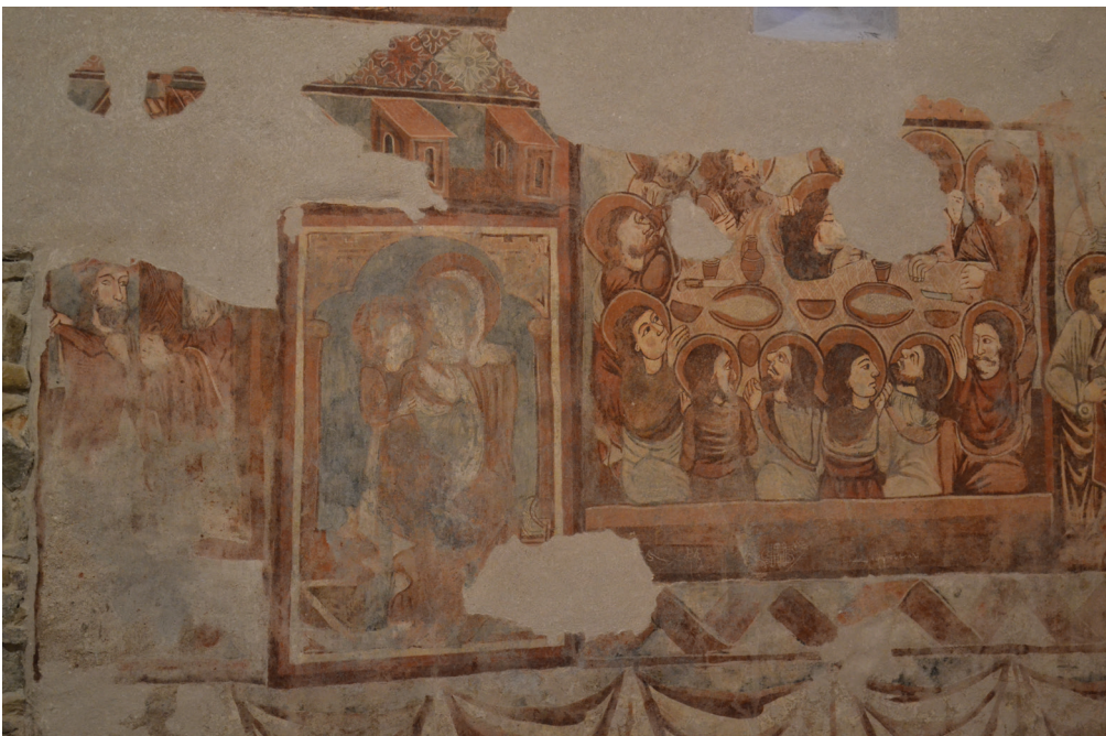
28. kép. Déli oldal középső regiszter: Bevonulás Jeruzsálembe, Mária gyermekével és az Utolsó vacsora jelenetek.

megmunkálásbeli különbségek kétségessé teszik e falképek egyidejűségét (29. kép). A Mária gyermekével jelenet vakolatán ugyanis nem észlelhetők a Passió epizódjainak vakolatát sűrűn barázdáló, markáns spatulanyomok. Az is kérdésessé teszi az egyidejűséget, hogy a déli oldalon a Mária ábrázoláshoz hasonlóan több, ennyire megkopott festett felülettel nem találkozunk.