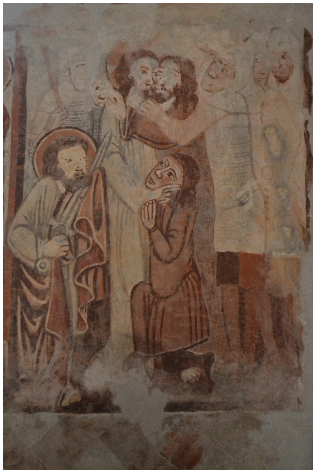
12. kép. A lekopott festékréteg miatt láthatóvá vált okkerszínű alárajz a Júdás csókja jeleneten. Részlet.

A legelső regiszterben a lábazati részre egy csavart vörös szalag, valamint drapériamotívum került. Ennek nagy része fennmaradt a déli bejáratától a nyugati falig (13. kép).