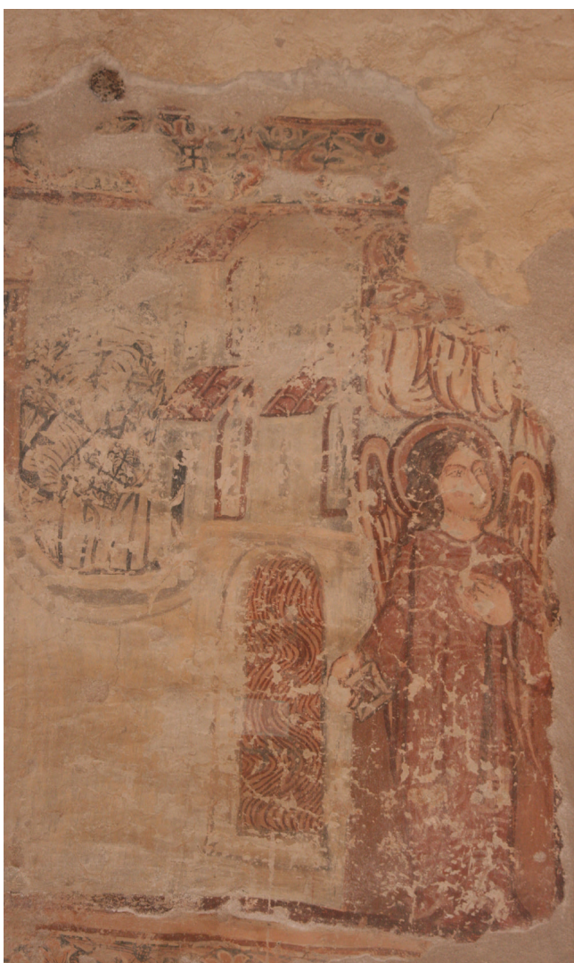
26. kép. Részlet a Mennyek országáról.

teret kapott. Az építészeti elemek többnyire laposak és díszletszerűek. Enyhe próbálkozást a Mennyek országának erődtményénél láthatunk (26. kép).