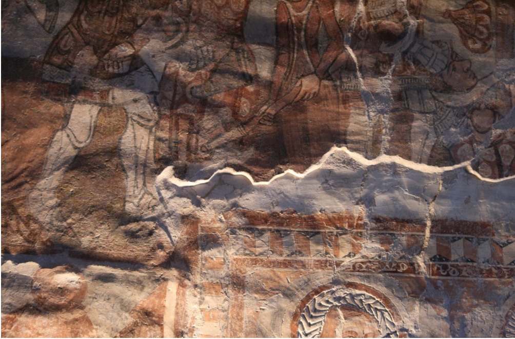
18. kép. A Szent Kozma és Damján jelenet vakolata benyúlik a felette lévő Szent László-legenda vakolata alá. A korábbi feltételezésekkel ellentétben korábban készült, mint a Szent László képciklus. Részlet, surlófényes felvétel.