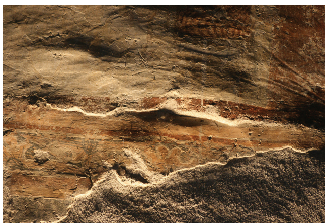
8. kép. A középső regiszterben lévő kosarat vivő szent ábrázolásának vakolata benyúlik a felső regiszter vakolata alá. Súrlófényes felvétel, részlet.

A déli falon a középső regiszterben több jelenet is van. A Mennyország kapuja alatti első jelenet – melyen egy kosarat vivő szent glóriás alakja látható – nagy részét a később nyitott bejárati ajtó tönkretette. A vakolat felső