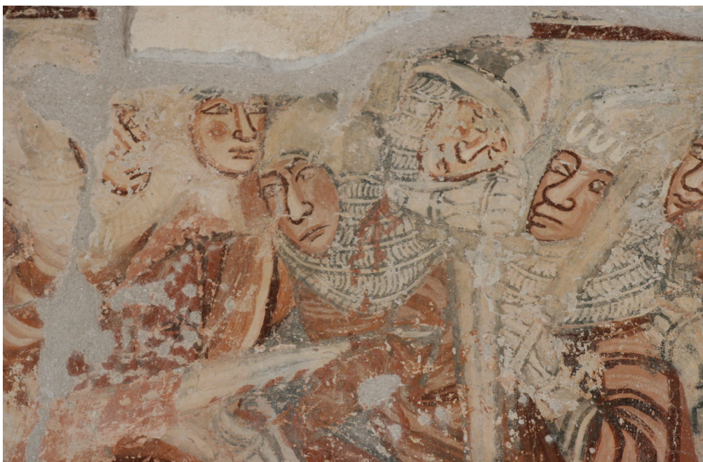
17. kép. Részlet a Szent László-legenda Ütközet jelenetéből.

gyar katonák sokasága már sokkal változatosabb testhelyzetet mutat. A jelenet legdíszesebb lova Szent Lászlóé.