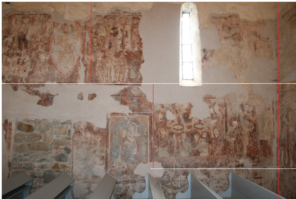
1. kép. A templom déli oldala: ---- állványszintek, ..... függőleges vakolathatárok.

A felső regiszterben az Utolsó ítélet jelenete, alatta Bevonulás Jeruzsálembe, Mária gyermekével, Utolsó vacsora, Júdás csókja jelenetek.