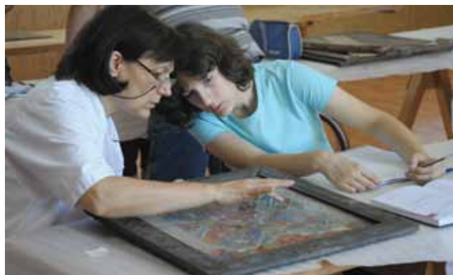
3. kép. Az ikonok tanulmányozása.