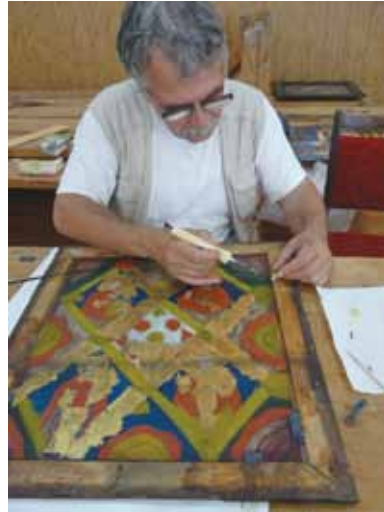
15. kép. Üvegikon rögzítése a keretben szintetikus filc lapokkal.