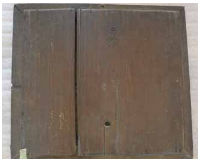
6. kép. Az ikon hátoldala restaurálás előtt.