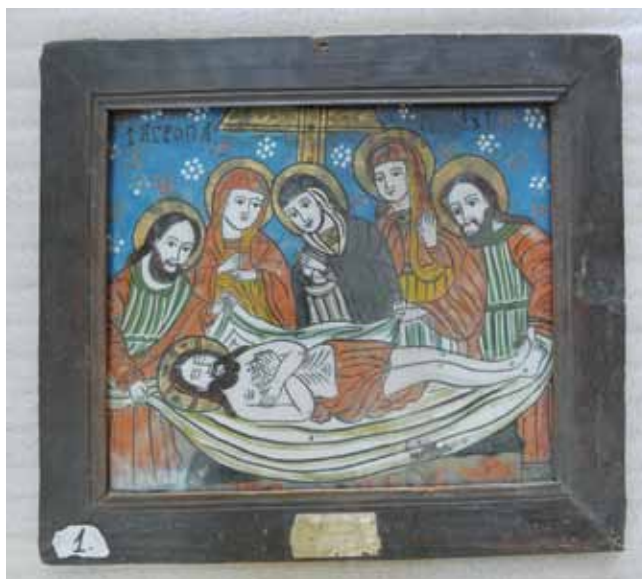
5. kép. A Krisztus sírba tétele c. ikon restaurálás előtt. Az ohábai ortodox templom gyűjteménye.

A készítése technikai felmérést és anyagvizsgálatokat a károsodások, és azok okainak meghatározása követte. A közel két évszázad, az egyszerű technika, valamint a mostoha körülmények számos kárt okoztak az ikonokon: a festékrétegek felválását, vagy hiányát, a keretek és