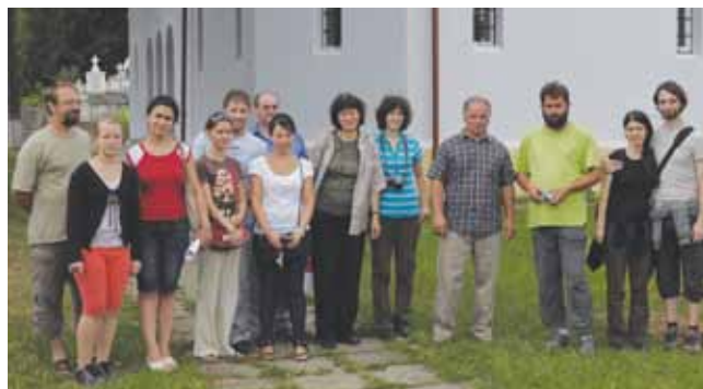
1. kép. Az első üvegikon restaurálás táborban résztvevő tanárok és diákok. Ohába, Brassó megye, 2010. augusztus.

Így, együtt – a rossz gazdasági körülményeket is figyelembe véve – kidolgoztuk a negyven nagyon károsodott üvegikon restaurálásának stratégiáját. Az egyetlen és lehető legegyszerűbb, valamint olcsó megoldásnak egy restaurátor tábor megszervezése tűnt. Az ilyen helyszíni projekthez három fontos dolog szükséges: 1.) diákok hívása, 2.) koordinátorok bevonása, 3.) szponzorok keresése. Kérésünkre a nagyszebeni „Lucian Blaga” Egyetemről 3 nagyon gyorsan pozitív választ kaptunk. Engedélyezték, hogy a diákok a nyári konzerválás-restaurálás gyakorlatukat ebben a táborban töltsék, és a szükséges anyagokat is biztosították számunkra. A következő lépés az ASTRA Múzeum-beli restaurátor kollégák felkérése volt, akik azonnal csatlakoztak a programhoz. Mindeköz-