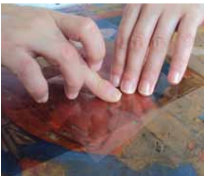
10. kép. A festékréteg rögzítése.

a borítólemezek rendkívüli szennyezettségét, és esetenként üvegtöréseket. Mind a tizenegy ikonra, amelyek restaurálásra kerültek, jellemző volt, hogy a festett rétegeket vastag szennyeződés és rovarok anyagcsereterméke fedte, ami a bennük lévő anyagok hatására gyakran visszafordíthatatlan színváltozást okozott (4–8. kép).