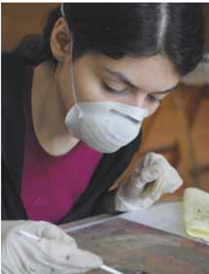
9. kép. Szennyeződés eltávolítás és mintavétel.