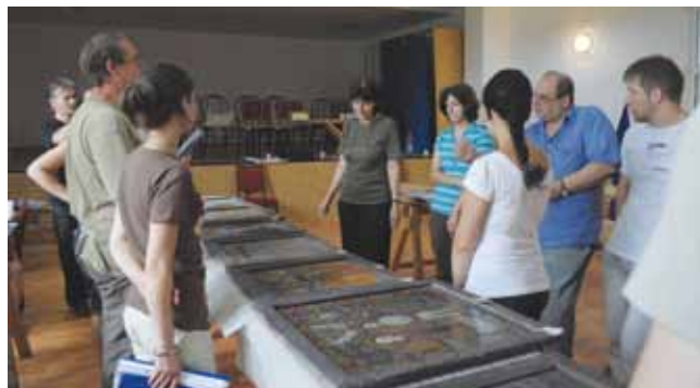
2. kép. A gyűjtemény állapotának felmérése.