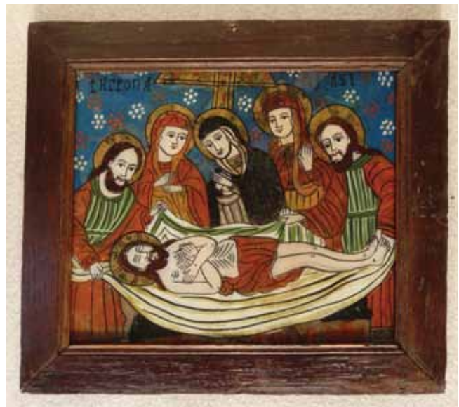
16. kép. A restaurált ikon.

Ohába falu, földje és lakosai Isten által áldottak, és mi büszkéek vagyunk arra, hogy valamit otthagyhattunk szívünkéből, lelkünkéből és a kezünk által; néhány restaurált üvegikont, egy nagyon kis részét nemzeti örökségünknek.