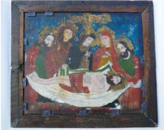
14. kép. A Krisztus sírba tétele c. ikon a keretbe való visszahelyezés után.

Az ikonok mellett képes tablókön mutatták be restaurálásuk folyamatát, ami a közönség számára jobb megérthetőséget biztosított.