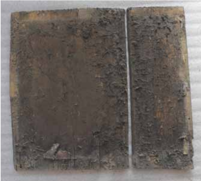
8. kép. Az ikon hátsó fedőlemeze kibontás után.