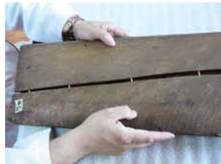
13. kép. A borítólemez mechanikus megerősítése.

A károsodások meghatározták a szükséges beavatkozásokat – így a felületi szennyeződések mechanikus eltávolítását, a felvált és nagyon érzékeny festékrétegek rögzítését, a rájuk tapadó szennyeződések eltávolítását és a festett felületek hiányainak retusálását (9–13. kép). A törött vagy hiányos ikonok esetében mind a festett, mind az üveg részekkel foglalkoztunk. Különös figyelmet fordítottunk az ikonokat védő elemekre, úgymint a keretekre és az igen törékeny hátsó borító lemezekre, melyek szilárdítás és kiegészítés után megfelelő stabilitást nyertek, és újra be tudják tölteni eredeti funkciójukat. Az utolsó lépés az ikonok keretbe illesztése volt, melyet olyan módon – műszálas filcek behelyezésével – végeztünk, hogy elkerüljük a festékrétegeknek az üveg és a keret súrlódásából adódó sérüléseit (14–15. kép). A restaurálás minden lépését dokumentáltuk.