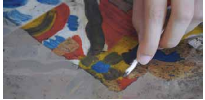
11. kép. A festékréteg tisztítása tojássárgája emulzióval.

a borítólemezek rendkívüli szennyezettségét, és esetenként üvegtöréseket. Mind a tizenegy ikonra, amelyek restaurálásra kerültek, jellemző volt, hogy a festett rétegeket vastag szennyeződés és rovarok anyagcsereterméke fedte, ami a bennük lévő anyagok hatására gyakran visszafordíthatatlan színváltozást okozott (4–8. kép).