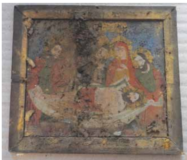
7. kép. Az ikon kibontás után.