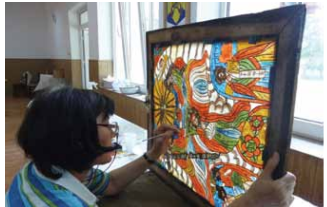
12. kép. Retusálás akvarell festékekkel.