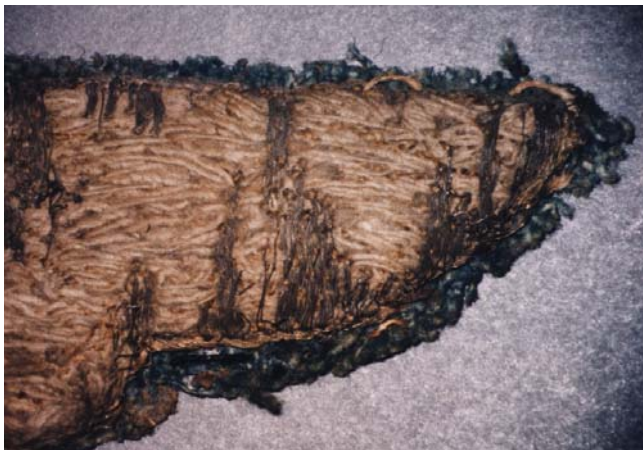
21. kép. Hiányos fémhímzés a tegez lebontott oldalzsebében. Részlet.

Fémfonallal hímzett textíliák díszítményeit általában színezett szalaszaggal pótoljuk. Ezzel a módszerrel történt egy 17. századi török nyíltegez restaurálása. 20