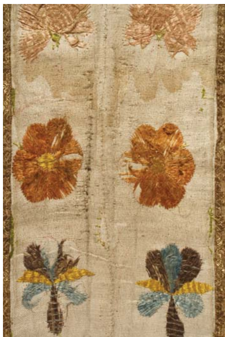
16. kép. Előrajzolás nyomok a miseruhán.