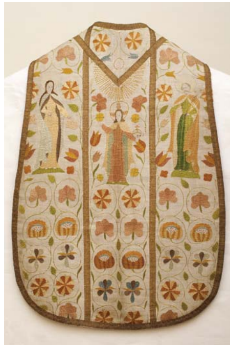
19. kép. A mise-ruha restaurálás után hátulról.