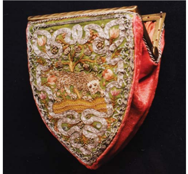
27. kép. A pénztárca restaurálás után.

A szálanyag alapú applikációk, gombok, 25 rátétek konzerválása, kiegészítése megegyezik a fent leírtakkal.