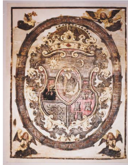
11. kép. A címer restaurálás után.