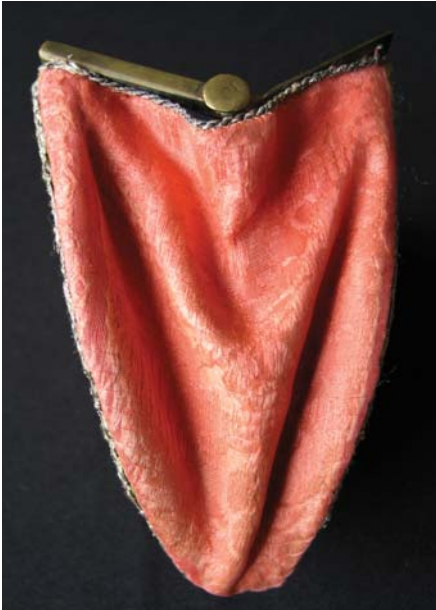
26. kép. A pénztárca oldala restaurálás után.

hátoldaláról. A korábbi beavatkozáskor készített stoppolás felfejtése után az eltérő mértékben károsodott szöveteket ezért szét kellett bontani és külön konzerválni. A bontás segítette a szakadt, hiányos oldalszövet varrókonzerválásának könnyebb kivitelezését is (25. kép).