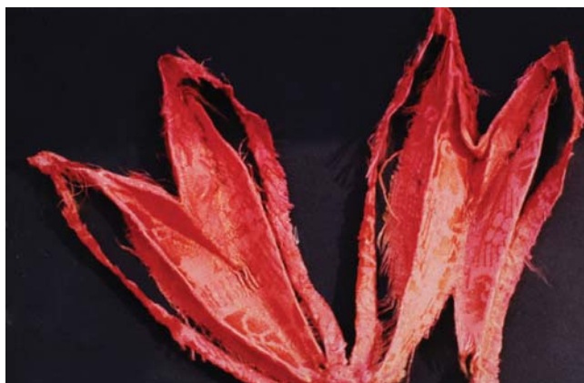
25. kép. A pénztárca oldalát alkotó szövet bontás után.

Az alábbiakban bemutatásra kerülő 18. századi, német pénztárca 22 díszítetlen textíliájának restaurálása is ezzel a módszerrel történt.