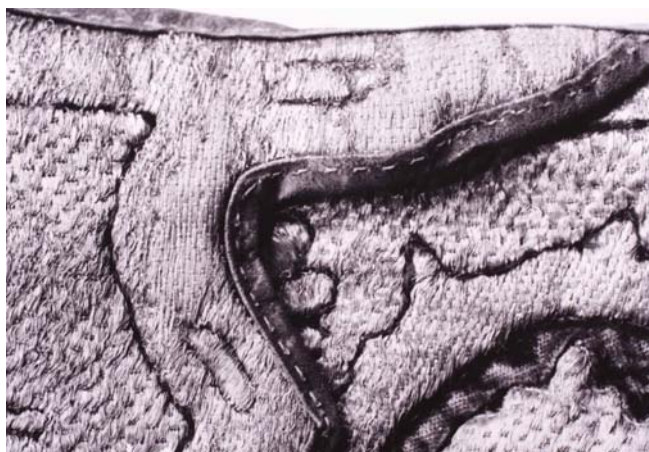
22. kép. Kiegészített fémhímzés. Részlet restaurálás után.