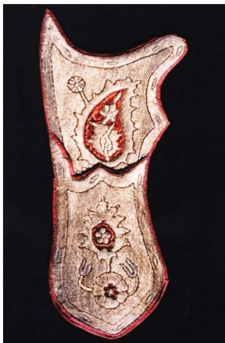
23. kép. A tegez restaurálás után.

alátöltő fonalak védelmét is biztosítja a továbbiakban. A pótlás az eredeti technika szerint került megvalósításra a megfelelő mintázatot létrehozó letűzéssel, de fémdrót helyett színezett pamutfonallal (22. kép).