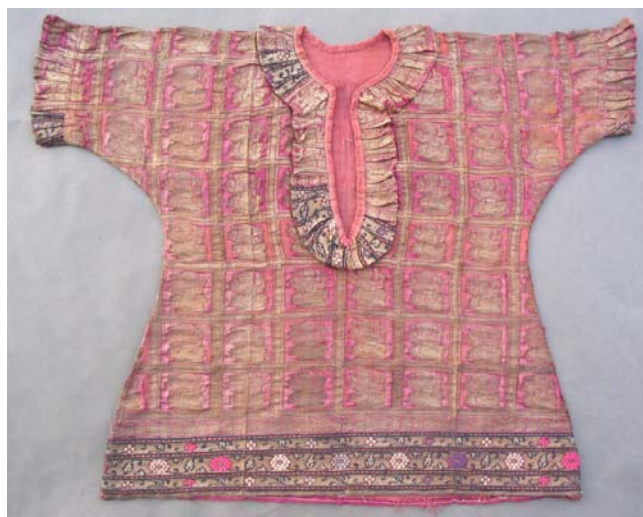
1. kép. 19. századi, indiai gyerekuhra eleje restaurálás előtt.

Restaurálás előtt a műtárgy gyűrött, rossz megtartású volt, vállánál és a mell vonalában, függőlegesen élés hajtatásnyomok húzódtak. A díszítő fodrok lelapultak, néhol