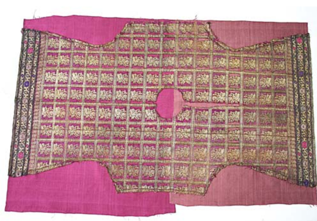
4. kép. A kétféle árnyalatúra színezett alátámasztó szövetek a ruha alatt.