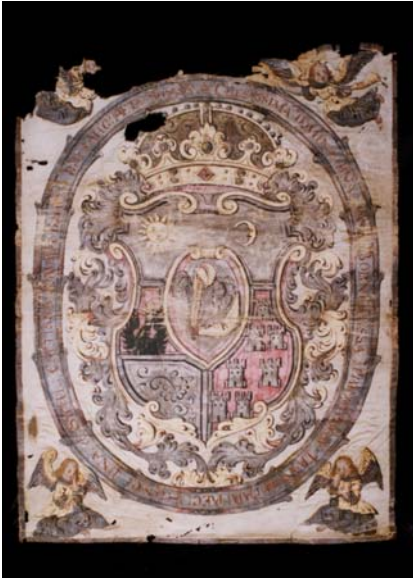
10. kép. 18. századi halotti címer restaurálás előtt.