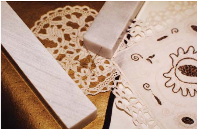
8. kép. A keszkenő egy csipkecsüngője restaurálás közben.