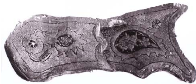
20. kép. 17. századi, török tegez restaurálás előtt.