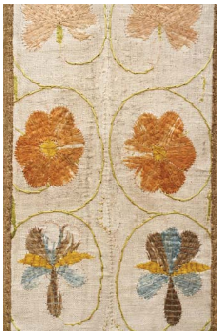
17. kép. A miseruha hímzésének részleges kiegészítése.

támasztást kaptak. A hordozó anyag a megerősítés mellett a szükséges helyeken a kiegészítés szerepét is betölti. A szövetek egymáshoz rögzítését lenfonallal varrt fércelő, a hiányok szélénél átfogó öltések segítették.