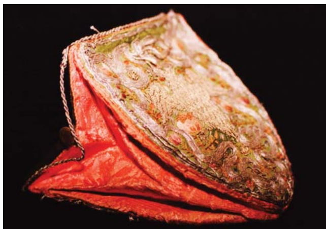
24. kép. 18. századi német pénztárca restaurálás előtt.

Egy díszített vagy díszítetlen szövet ilyen módon végzett lefedését szerkezeti szempontok indokolják. A vékony, átlátszó, de jó megtartású selyem felülről is védelmet biztosít az alátámasztott vagy egyéb módon kiegészített, sérült textíliának, megakadályozva ezzel a felület további károsodását. Hátránya e konzerválási eljárásnak, hogy következményeként a műtárgy mintázatának kontúrjai és színei tompává, fátyolosá válnak.