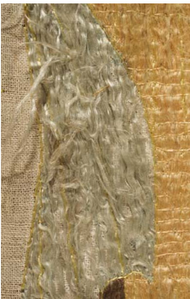
13. kép. A miseruha felbomlott hímzőfonalai.

foglalt mintázat töredékességében is egységes, harmonikus látványt nyújt.