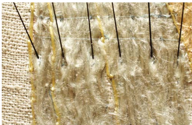
14. kép. A varrókonzerválást segítő, eredeti öltésnyomok.