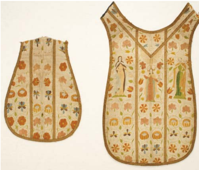
12. kép. 18. századi miseruha restaurálás előtt.