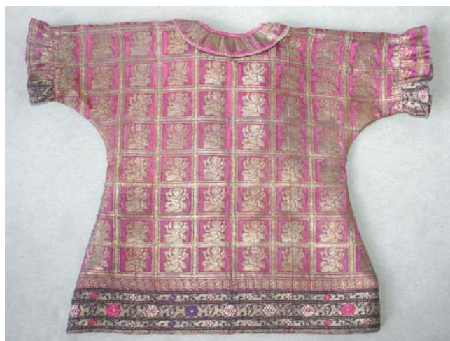
6. kép. A ruha háta restaurálás után.

A viselet újrarestaurálását a szakszerűtlen javítás eltávolítása, valamint a további károsodások kialakulásának megakadályozása indokolta. A fakult, a selyemszövet anyagával nem harmonizáló alátámasztó szövet és az elnagyoltan kivitelezett rögzítő öltések statikai szerepüket elvesztették, ezért szükségessé vált eltávolításuk.