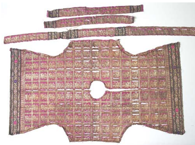
3. kép. A ruha bontás után, síkba kiterítve.