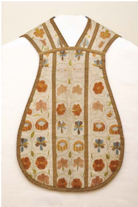
18. kép. A mise-ruha restaurálás után előlről.