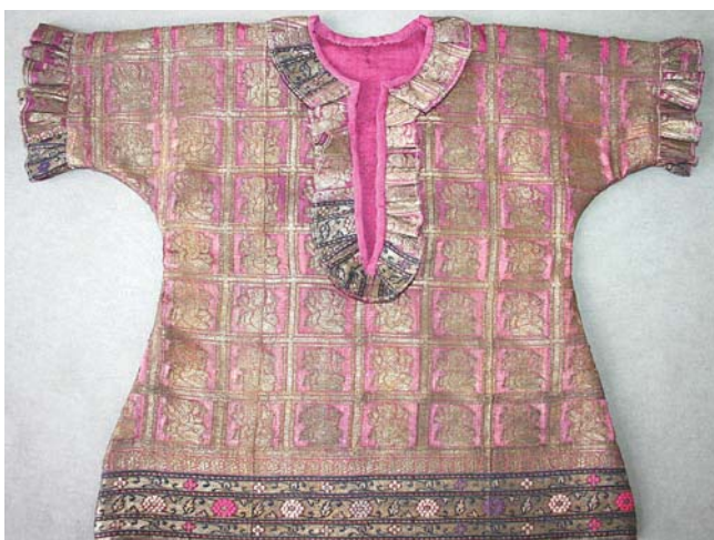
5. kép. A ruha eleje restaurálás után.