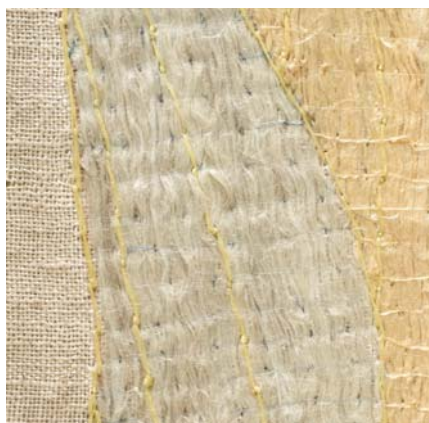
15. kép. A miseruha varrókonzervált hímzése.