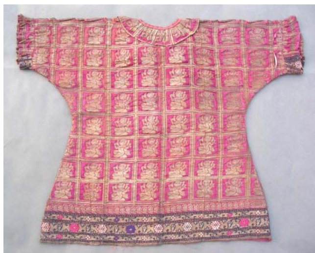
2. kép. A ruha háta restaurálás előtt.

felgyűrődtek. Széleiken gépi varrásból származó, egyenetlen tűnyomok futottak végig, melyekben néhol céna-maradványok maradtak meg. A szövet felületét több, kisebb méretű lyuk borította. A lyukak mentén a lánc és a vetülékfonalak, valamint több helyen a fémvetülékek is lebegtek. A selyem egyenetlenül fakult ki: a ruha elején jobban, mint a hátoldalán.