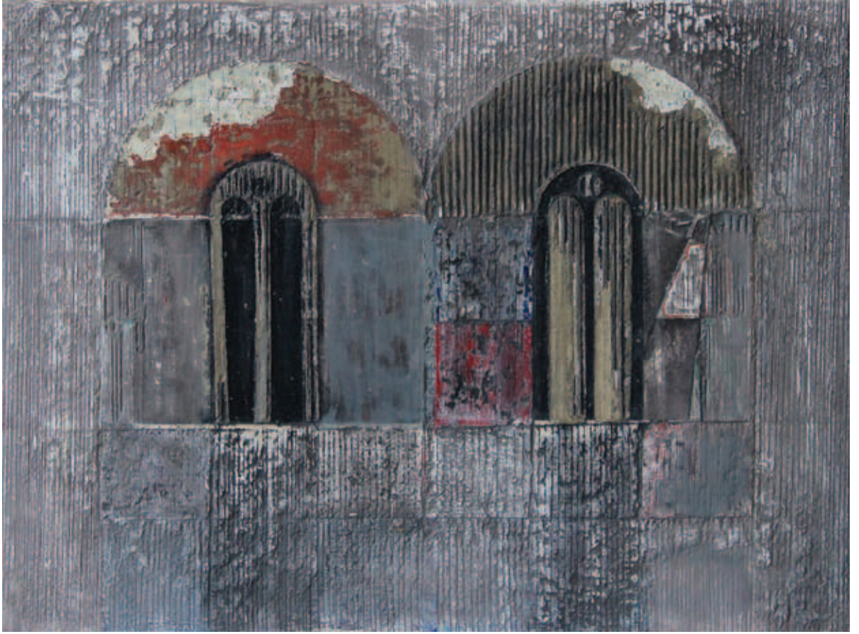
BUDAHÁZI TIBOR, Római töredékek XXIII.; X., 2015–19