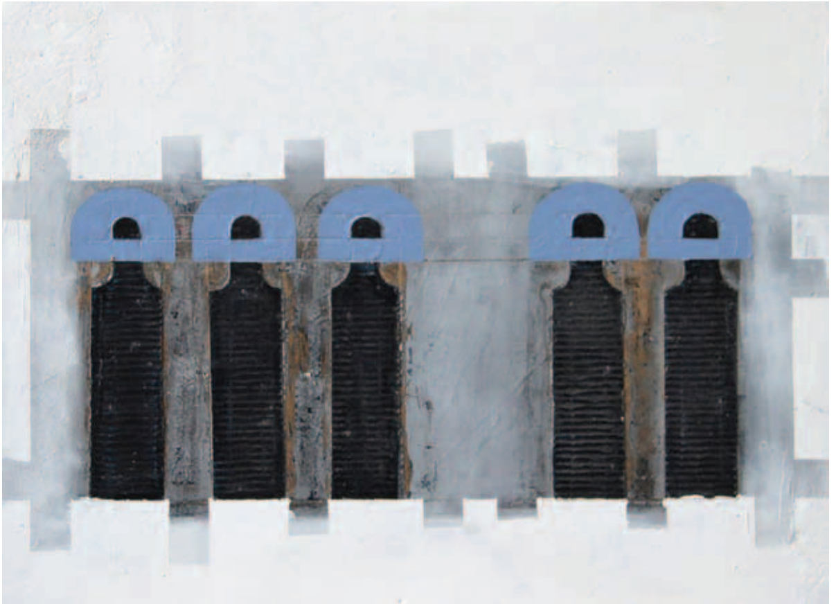
BUDAHÁZI TIBOR, Római töredékek XXIV.; VII., 2015–19