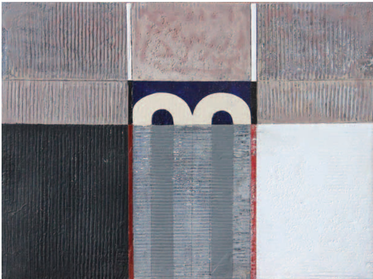
BUDAHÁZI TIBOR, Római töredékek XVIII.; XV., 2015–19