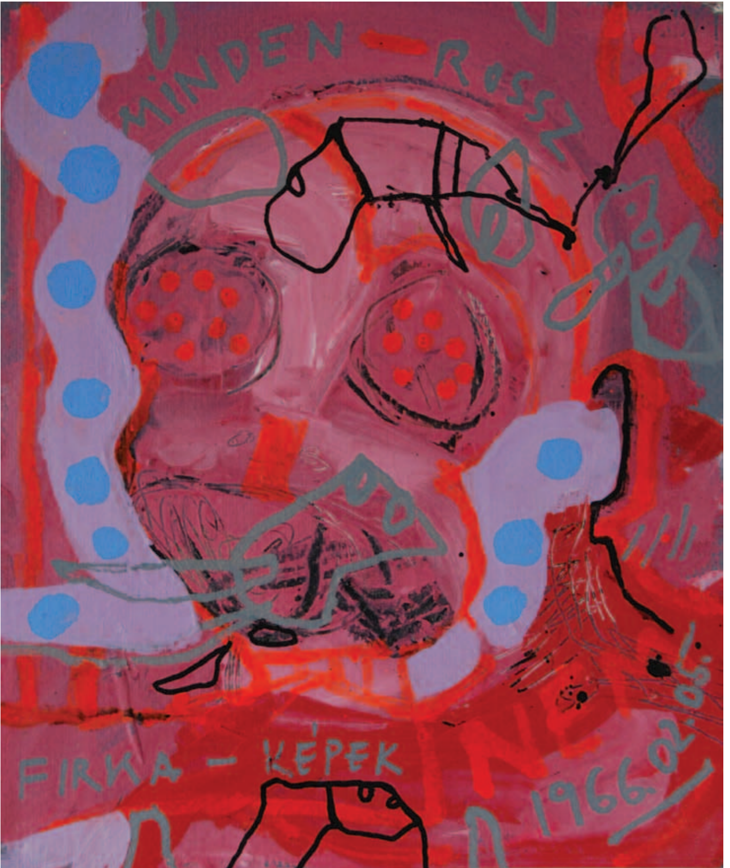
VANKÓ ISTVÁN, Firkált arc, 2018