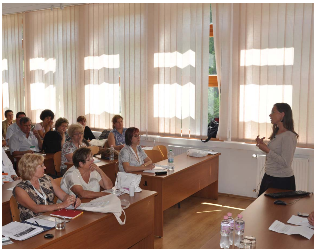
MKE vándorgyűlés, Helyismereti Könyvtárosok Szervezete

Az Informatikai és Könyvtári Szövetség hír- és levelezőlapja