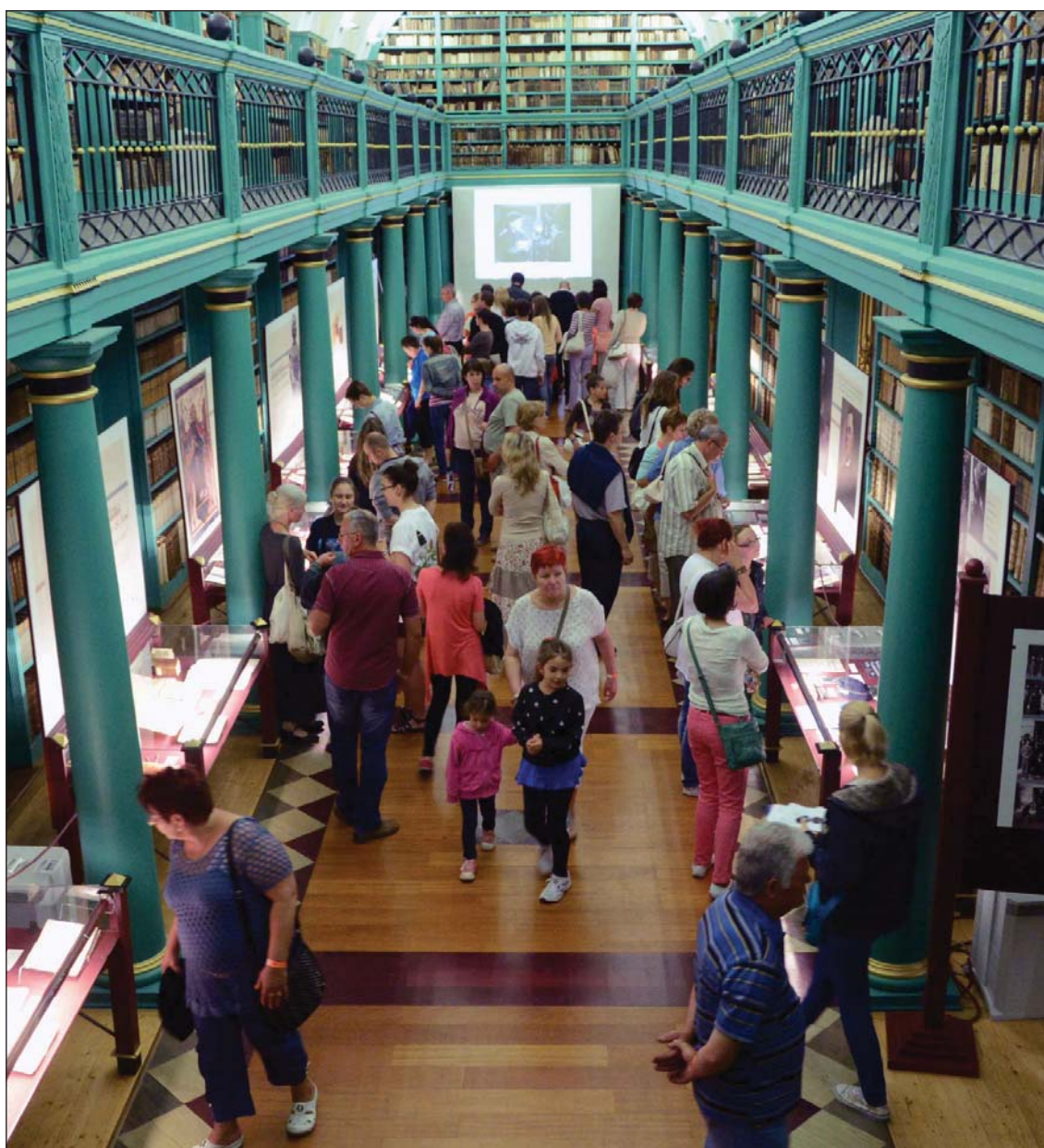
Tiszántúli Református Egyházkerület Nagykönyvtára – Múzeumok éjszakája, 2014

Befejezésül ismételten hangsúlyozom, hogy 23 kérdőív anyaga nem elegendő a teljes kép megalkotására, de ahhoz talán elégséges, hogy elgondolkodjunk szerepünkről és szolgálatunkról. ■