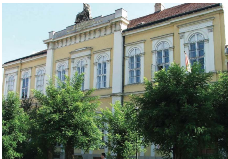
Bibliotheca Ecclesiae Metropolitanae Strigoniensis (Főszékesegyházi Könyvtár, Esztergom)