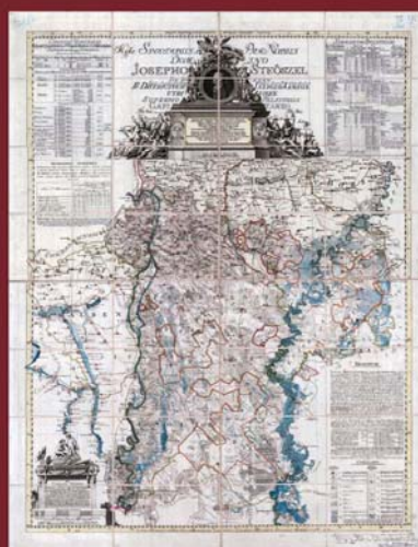
A KSH Könyvtár 1945 előtti magyar és magyar vonatkozású térképei

gédletként forgatjuk. Az első, kisebbik hányad a témához kapcsolódó tanulmányokat foglal magában, szám szerint négyet. Tekintsük át ezeket legalább cím szerint: A statisztika és a térkép (Matits Ferenc), Az Országos Magyar királyi Statisztikai Hivatal térképészete és térképei a nemzetközi földrajzi világkiállítások tükrében (Plihál Katalin), A történeti Magyarország etnikus viszonyainak térképi bemutatása az 1910. évi népszámlás alapján (Filep Antal), A KSH Könyvtár 1945 előtti térképeinek, illetve elektronikus térképészeti dokumentumainak felhasználása a Magyarország történeti helységnévtára (1773–1808) című sorozat köteteinél (Lelkes György). A statisztikai, földrajzi, néprajzi és helytörténeti