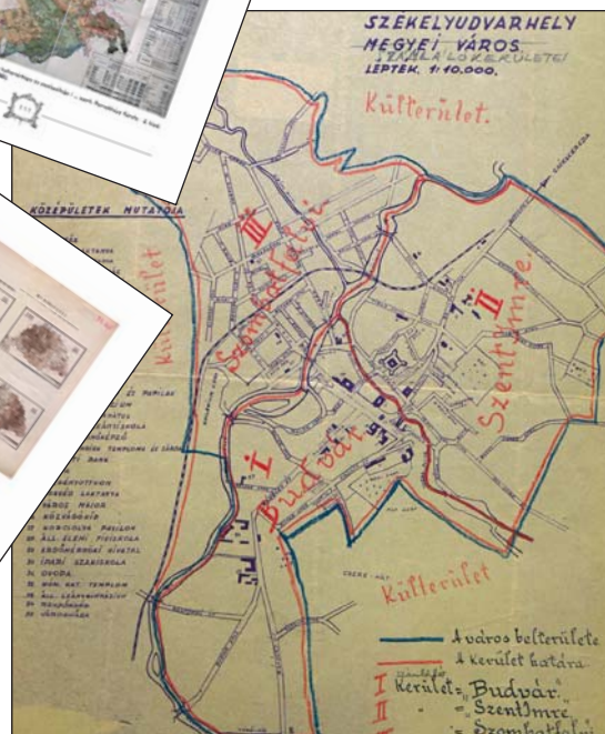
A KSH Könyvtár 1945 előtti magyar és magyar vonatkozású térképei. Szerk.: Nemes Erzsébet. Budapest : Központi Statisztikai Hivatal Könyvtár, 2013.

utalni az ismertetés bevezető soraira. Az éppen húszoldali (negyvenhasábnyi) felsorolásból világosan és látványosan kiderül, hogy a feldolgozott állományban milyen sok az egyes településekről (városokról, községekről, sőt pusztákról), az egyes megyékről született térkép. Ebből következően a helyismereti-helytörténeti tájékoztatás semmiképpen sem nélkülözheti ezt az igényes, színvonalas kiadványt.