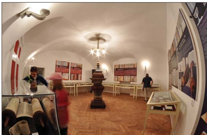
Liber et liturgia. Szertartáskönyvek Erdélyben a 16–19. században

Kiemelni egy-egy részletet, aláhúzni a Teleki Téka enciklopédikus tudásanyagának egy-egy érdekesebb aspektusát, ez volt mindenkoron a Téka időszakos kiállításainak funkciója. Az impozáns állandó kiállítás mellett, amely az állomány monumentalitását, illetve az alapító mindenre kiterjedő alapos szakértelmét és tudománypártoló nagylelkűségét juttatja önkéntelenül az ide belépő eszébe, a Teleki Téka időszakos kiállításai lehetőséget nyújtottak/nyújtanak az elmélyülésre is a régikönyves paletta specifikus részletekérdéseibe, illetve megengedték/megengedik, hogy a mindenkoron szolgáló könyvtárosok is belophassák víziójukat egy-egy általuk inkább szakértett területről. Az időszakos kiállításokat Teleki Bibliothecájának eredeti olvasótermében rendezik már több mint harminc éve, és ez idő alatt a bibliofil közönség láthatott