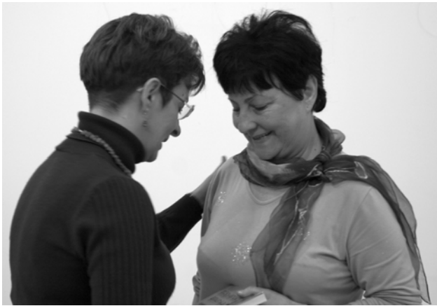
Amikor neki mondanak köszönetet

tanos is voltam, de végül ráébredtem, hogy a legjobb lenne önálló könyvtárosként dolgozni, ahol – úgymond – a magam ura lehetek, és annyit dolgozhatok, amennyit csak bírok.