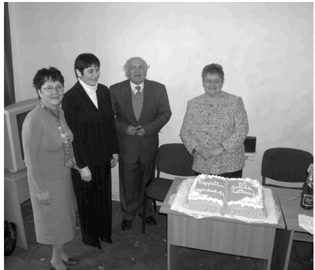
Öt éves a Kárpátaljai Magyar Iskolai Könyvtárak Információs Egyesülete

Igyekeztem otthonossá tenni a könyvtárat, hogy végre valóban szeressenek odajönni diákok, tanárok egyaránt. Kiállításokat szerveztem Iskolagaléria címmel, ahol a mi rajztanárunk meg más tanárkollégák alkotásai szerepeltek: tűzzománc, fotó, gyöngyfűzés, a könyvtár régi könyvei. Sikerült odavonzani a látogatókat, az olvasókat. Szerencsére volt egy nagyon aranyos első évfolyam, ők igen szerették a könyvtárat. Legalább tíz olyan gyerekem volt, aki ott sündörgött állandóan, mert „finom könyvtári levegő” van – mondták. Ők voltak azok, akik lelket