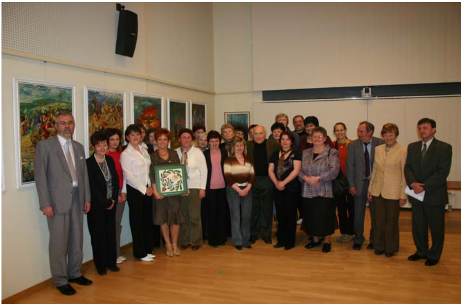
Csoportkép a továbbképzés résztvevőiről