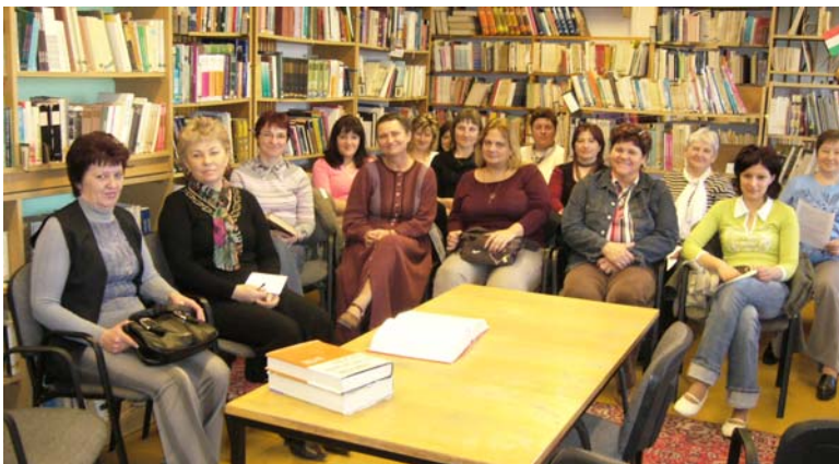
A Kertvárosi Általános Iskolában

mények és civil szervezetek közös munkája milyen hatékony lehet.